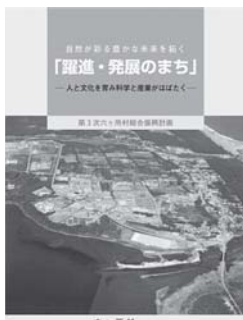
六ヶ所村第三次振興計画

いづれにしても、本村の観光については、重要な産業のひとつと捉えており、村民を始めとする観光客のレクリエーション志向に因應するべく施設の整備を展開してまいりたい。