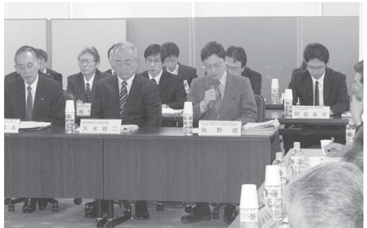
国・電気事業連合会等の説明者

その内容について、村長から議会に対して説明したい旨の要請があり、3月議会定例会最終日の3月12日(金)に議会