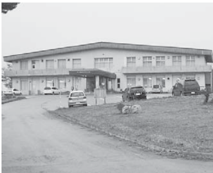
空室となる酪農会館

経営の安定を図るといふ考え方は大事な点であるが、採用する側がその点についてどのように対応していくのか、その点に關与することはなかなか難しいが、地域の企業に對し地元雇用ということに常日ごろから要望している。就職率向上については、いろいろな手立てを講じて、人材の育成を図りながら、地元企業に就職できるように努力してまいりたいと考えている。