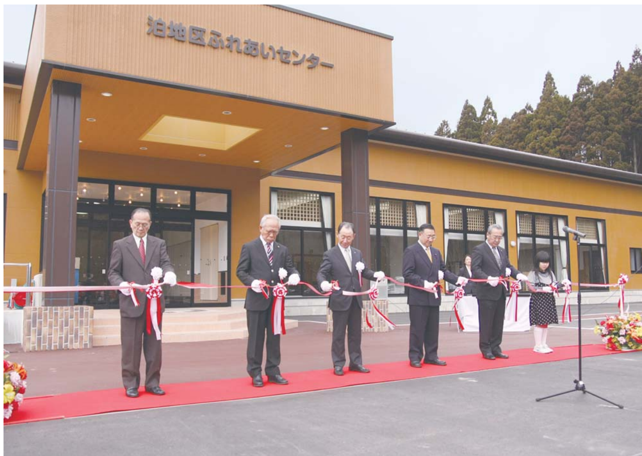
泊地区に温浴施設を併設したふれあいセンターが完成