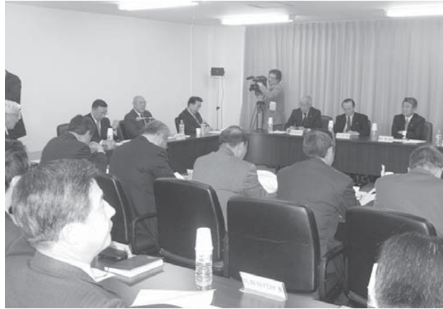
議会議員全員協議会の様子

電力各社が海外(フランス及びイギリス)に使用済み燃料の再処理を委託したことによって返還される低レベル放射性廃棄物等について、去る3月1日に資源エネルギー庁から、また翌日の2日には電気事業連合会及び日本原燃株から村長に対して要請があった。