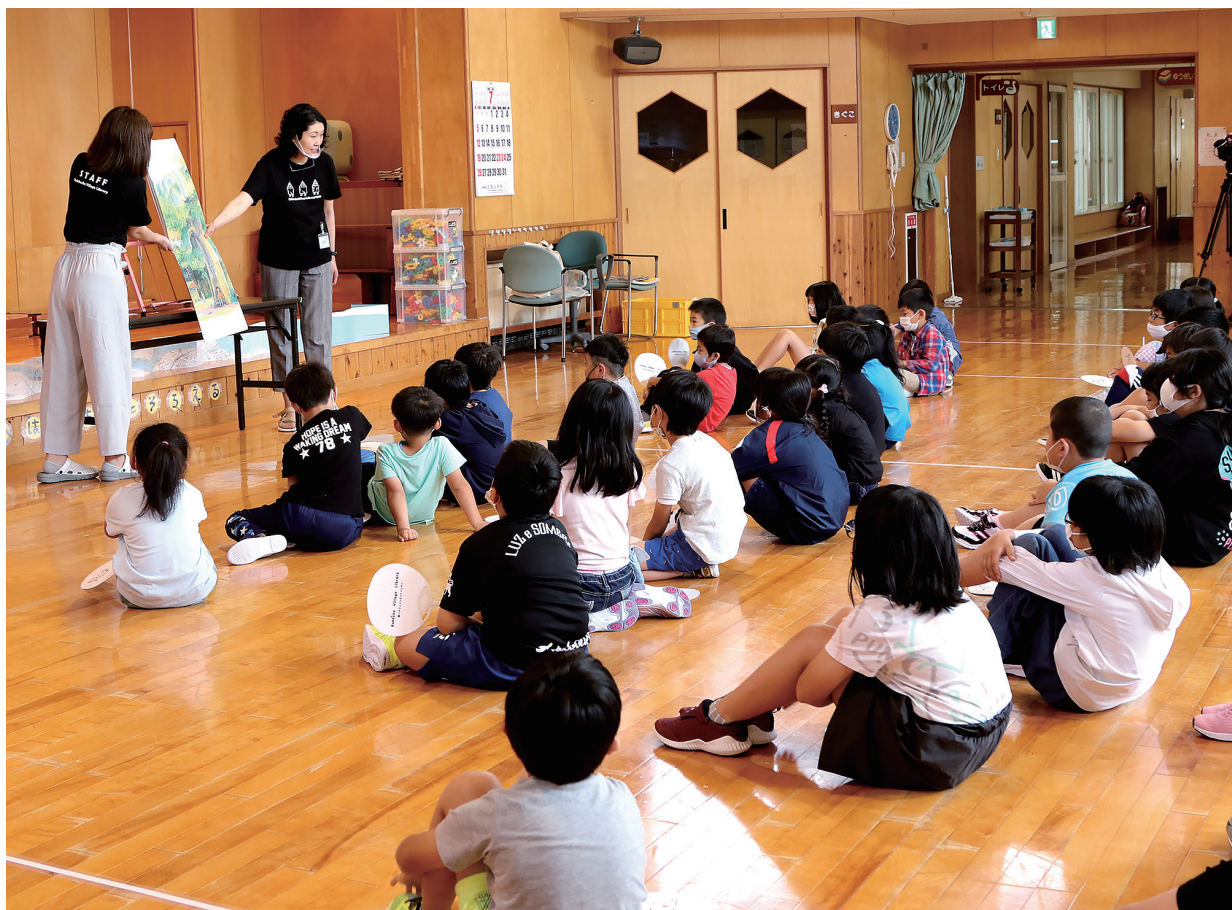
村民図書館による「夏の出張お話会」の様子 なかよし塾にて（7月29日撮影）