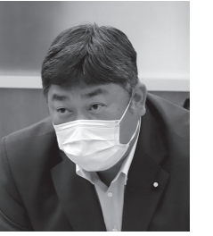
附田 角栄 議員