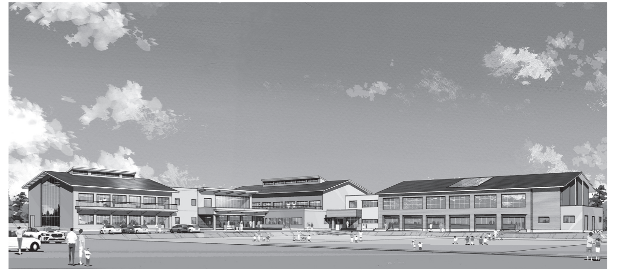
千歳平小学校イメージパース（令和3年度末に完成予定）