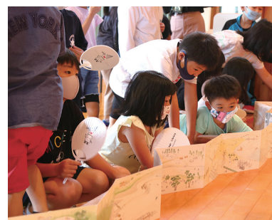
絵本を読む子どもたちの様子