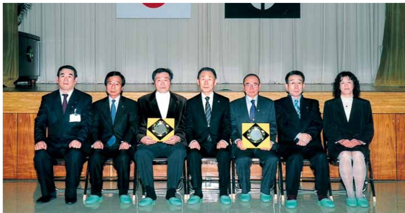
文化賞受賞者の皆さん