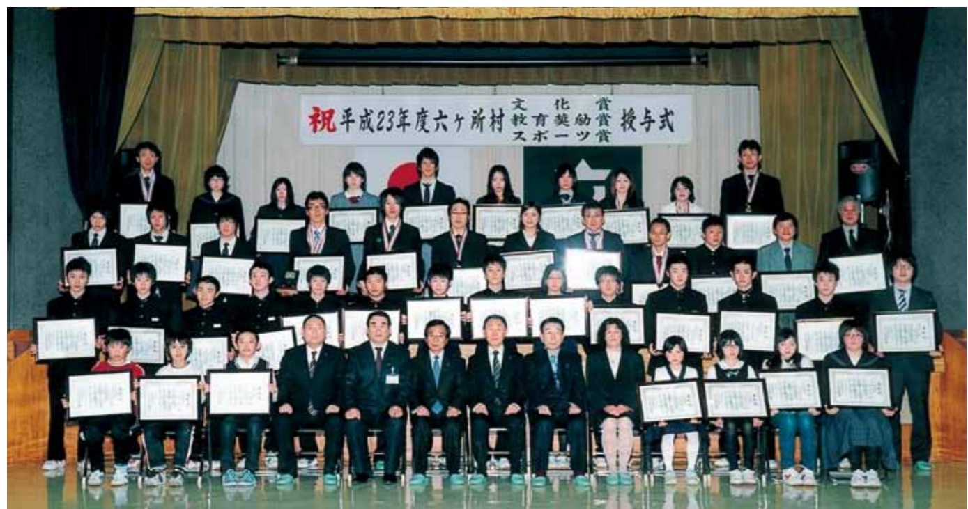
スポーツ賞受賞者の皆さん