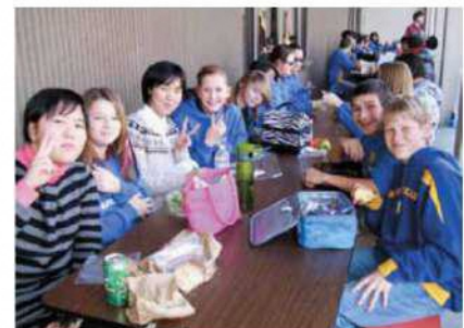
ゴールデンヒルズ・ミドルスクールの生徒たちとランチを一緒に