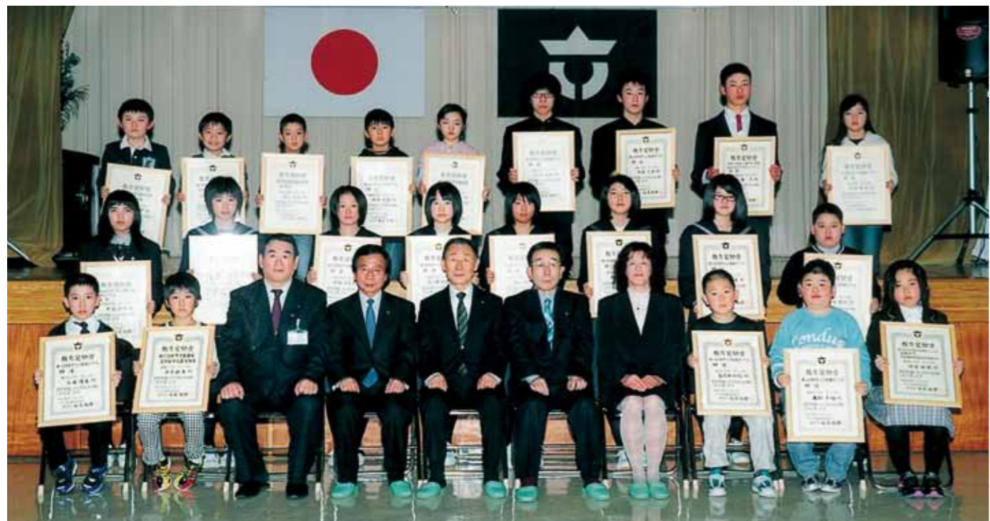
教育奨励賞受賞者の皆さん