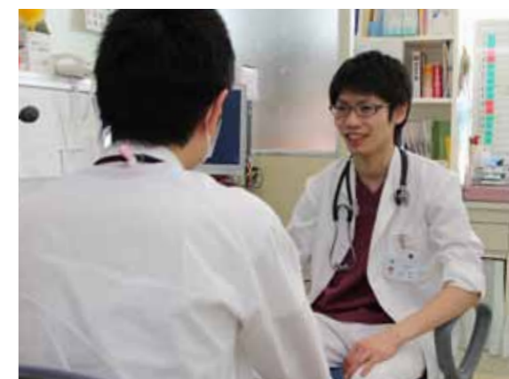
身近なお医者さん「かかりつけ医」をもちましょう