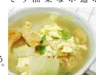
干しタラのスープは二日酔いに効果的です

①サンミとクッキング! 干しタラスープと宮中トッポッキ 今月のメニューは干しタラのスープ(フゴクツン)と宮中トッポッキです。美肌にも効果的なスープですが、韓国では二日酔いにも効果的なスープで有名です。 宮中トッポッキは、普通の辛いトッポッキではなく、肉と野菜を入れて醤油ベースで作る料理です。 昔、宮殿で王様が食べたトッポッキとスープを楽しみながら韓国体験をしてみませんか。 【日時】3月12日(月) 午後6時〜9時 【場所】中央公民館 【募集人数】20人まで 【参加費】材料代 【申込期限】3月9日(金) (内線263)