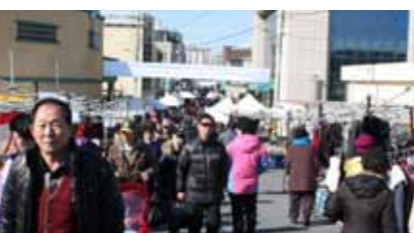
襄陽郡では4と9の付く日に朝市が開催されます。野菜、魚介類、衣料品などいろんな物が売られています

また午後4時くらいには韓国おやつ定番のトッポッキ、キンパ・スンドゥなどのほか、ピザやチキンが出てきます。 韓国の冬は気温が非常に低いので外に買い物や食事に出かけるのがおっくうになり、外食と値段がさほど変わらない出前を利用する頻度が増えるのではないかと思います。 私も一度だけ出前を利用したことがあります。が、注文の電話でも緊張しました。韓国生活も残り少なくなってきたのでもう一度くらい出前を利用して、韓国語が少しは上達したか試してみたいと思います。