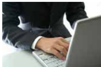
インターネットでも入るから、欲しい情報がいくつでも入ることに注意

インターネットは、いつでも好きな時に、自分が欲しい情報を欲しいだけ得ることができたいへん便利なツールです。しかし、その一方では、違法情報・有害情報にアクセスしたことが原因で、子どもたちが犯罪に巻き込まれてしまうケースが多く発生しており、非常に大きな問題となつています。