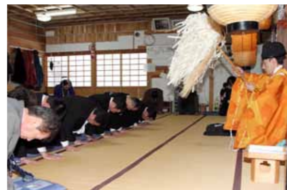
大幣（おおぬさ）でお祓いを受ける参加者

泊地区に古くから伝わる合同厄払いが2月1日、泊地区の神社で行われ、今年が大厄にあたる男性6人が無病息災などを祈願しました。合同厄払いは厄年の男女（男性は数え年42歳、女性は33歳）が地区内の各神社を祈祷して歩くのが習わしですが、今年は女性の参加がありませんでした。