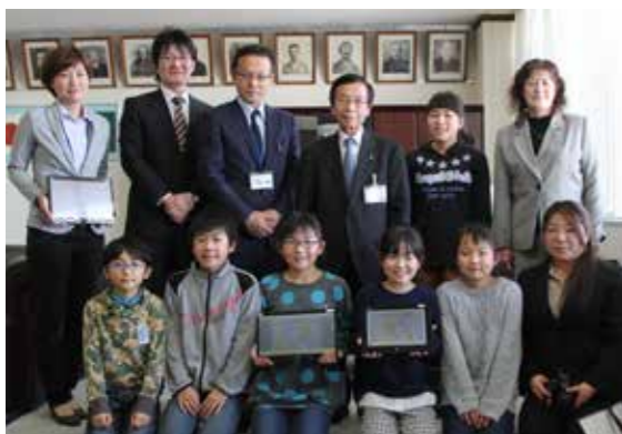
村長室を訪れた尾駈小学校の皆さん

尾駈小学校の4年生（38人）が社会科学習の取り組みでまとめた「ごみ減量化対策に向けた取り組み提案」のアイデア説明のため、代表児童6人が3月17日、村長室を訪れました。