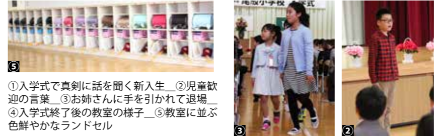
①入学式で真剣に話を聞く新入生 ②児童歓迎の言葉 ③お姉さんに手を引かれて退場 ④入学式終了後の教室の様子 ⑤教室に並ぶ色鮮やかなランドセル