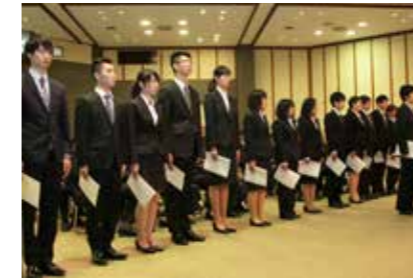
村長から辞令を受け取る新採用職員

住民の皆さんは何を望んでいるのかをよく考え、村政発展と住民サービスの更なる向上の実現に向けて職員一同、取り組んで参りますので宜しくお願いいたします。