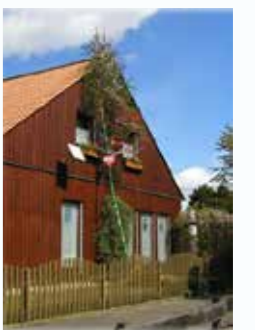
昔もらった「マイバウム」