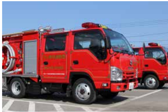
新しく配備された小型動力ポンプ付積載車

村消防団の第2分団（新城平地区）および第3分団（庄内地区）に配備する小型動力ポンプ付積載車の入魂式が3月14日、尾駈地区の多目的広場駐車場にて執り行われました。