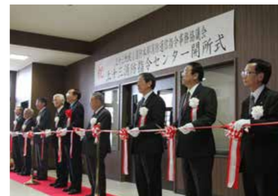
テープカットで開所を祝う

上十三消防指令センター開所式が3月24日、十和田地域広域事務組合十和田消防庁舎で行われました。