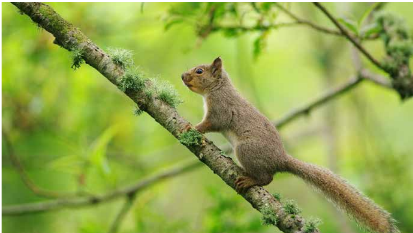
細い枝の上は、長い尾でバランスをとりながら歩いていました

バリバリと大きな音を立て、枯れた松の太木を鋭い爪で駆けて登っていく姿にびっくりすることがあります。