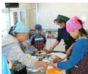
親子で楽しく朝食づくり

2月22日、南小学校で料理教室とダンス教室が開催されました。料理教室は食生活改善推進員が講師となり、親子で楽しく朝食づくりを行いました。当日は6グループに分かれ、チーズおにぎりやアスパラベーコンとカレー炒めなどを作りました。