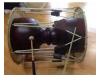
サムルノリで使われる打楽器「チャング」はパチを使って演奏

日本でも、盆踊りなどの祭りにおいて太鼓や笛を演奏しますが、韓国でも同じように太鼓やかねを叩いて五穀豊穡の祈願や収穫の感謝を捧げていました。