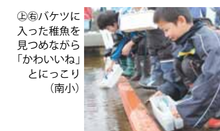
④⑤バケツに入った稚魚を見つめながら「かわいいね」とにっこり（南小）