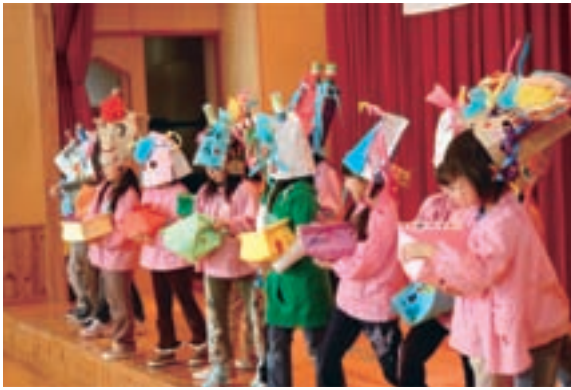
一列に並び、鬼に向かって豆まきをする子どもたち