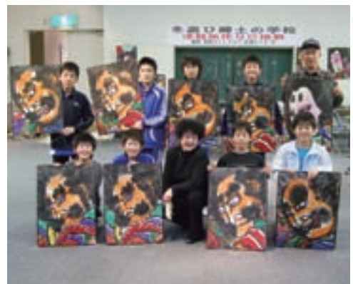
制作に6時間。それぞれの個性が光ってます

終了後、児童たちは「早く飛ばしてみたい」「絵を描くのが難しかったけど、楽しかった」と笑顔を見せていました。