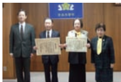
(左から)石川県警本部長、古川村長、 渡部会長、間宮県連合会長