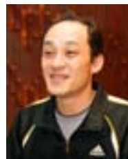
能登一之団長 「年齢問わず気軽に 参加できる。どんでん 交流を楽しんで」

「総合型」は▽種目▽世代や年齢▽技術レベルの3つの多様性を指し、子どもから大人まで、体力・技術・技能に合わせてさまざまなスポーツを楽しめるのが特徴。地域のスポーツ少年団と連携し、長期的な視野に立った選手の育成ができる利点がある。文部科学省の委託を受けた(財)日本体育協会は、全国の市区町村に少なくとも一つのク