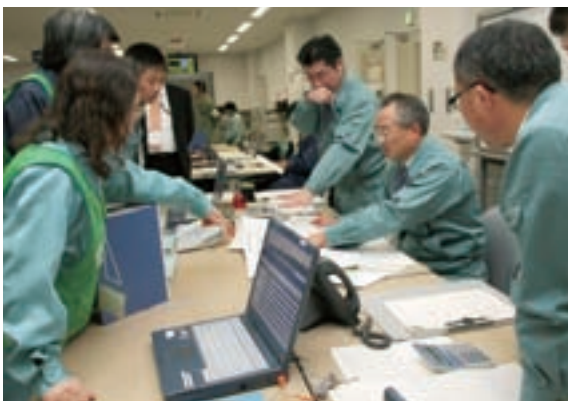
応急対策を検討する村現地連絡本部員（訓練）