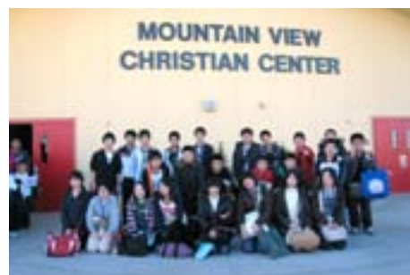
トリニティ・クリスチャン スクールを訪問

報告会で「アメリカと日本の違いを感じた」「自分の英語力が上がったので、これからもっと勉強したい」など、滞在時のハプニングや笑いを交えて報告した生徒たち。堂々と発表する姿は、渡米前に比べ一回り成長したようでした。