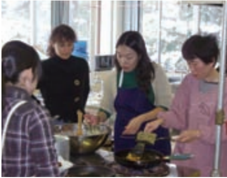
ライバクヘン作りに取り組む参加者たち

1月27日に、韓国対ドイツ料理教室を中央公民館で行いました。韓国のメニューは「タンホバク・ヘムルチム（カボチャの海鮮蒸）」、ドイツは「ライバクヘン（ジャガイモのお好み焼きとりんごピュレ）」、「トマトスープ a l a