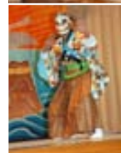
今回復活の「虎ノ口」