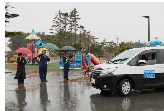
パレードに向かう車両を見送る

春の全国交通安全運動に伴うパレード出発式が4月9日、中央公民館で行われました。出発式には、関係団体など8団体、約40人が参加しました。同運動は春の全国交通安全運動期間である4月6日から15日までの10日間、交通事故防止の徹底を図ることを目的に行われました。