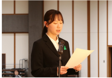
新採用職員によるサービスの宣誓