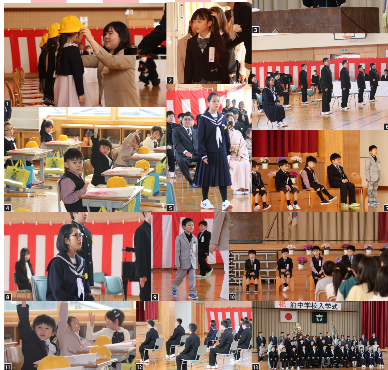
* ①～②・④・⑦・⑨～⑪は泊小学校、③・⑤～⑥・⑫～⑬は泊中学校の入学式の様子