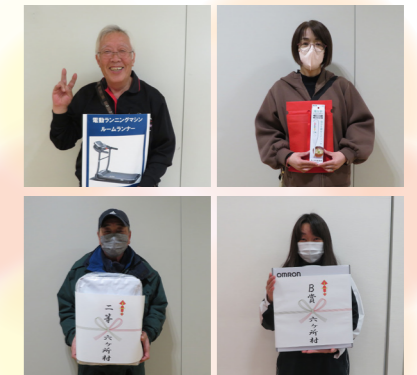
当選者の皆さん おめでとうございます