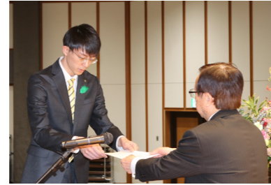
辞令を受け取る新採用職員⑤

六ヶ所村職員辞令交付式が4月1日、中央公民館で行われました。村政発展と住民サービスの向上実現に向けて職員一同、取り組んでまいりますのでよろしくお願いいたします。