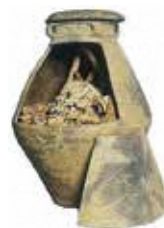
人骨入り甕棺土器

昭和46年に旧農林省上北馬鈴薯原々種農場の職員が、耕作時に人骨入りの甕棺土器 かみきた ぼれいしよげんしゆのうじょう を発見しました。これは再葬土器棺墓 かめかん どき という縄文時代後期(約4,000年前)に青森県を中心としてみられるお墓です。土葬が主な縄文時代に、被葬者は石棺墓 せきかん ぼ に埋葬され、数年後掘り起こし洗骨してから甕棺土器に入れられて再び葬られていました。頭骨は縄文人の特徴である四角い眼窩 がん か 、成人の時や出産時に魔よけとして通過儀礼が行われた抜歯の痕が2か所、額が立っていることから二十歳前後の女性という事がわかりました。彼女はムラの中でどのような存在で、どのような生活を送っていたのでしょうか。当時は、気候の寒冷化が起こり三内丸山遺跡などの大集落が衰退し、小さな集落へ分散化した時代でした。