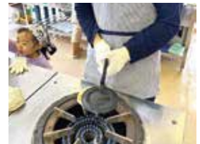
南部せんべい手焼き体験会

六ヶ所村でも大正時代から南部せんべいが食されていました。鉄製の焼き型を使って、伝統的な白せんべいや好きな具材を入れてオリジナルのせんべいを焼きます。会場は六ヶ所村立中央公民館、材料費は1組500円です。