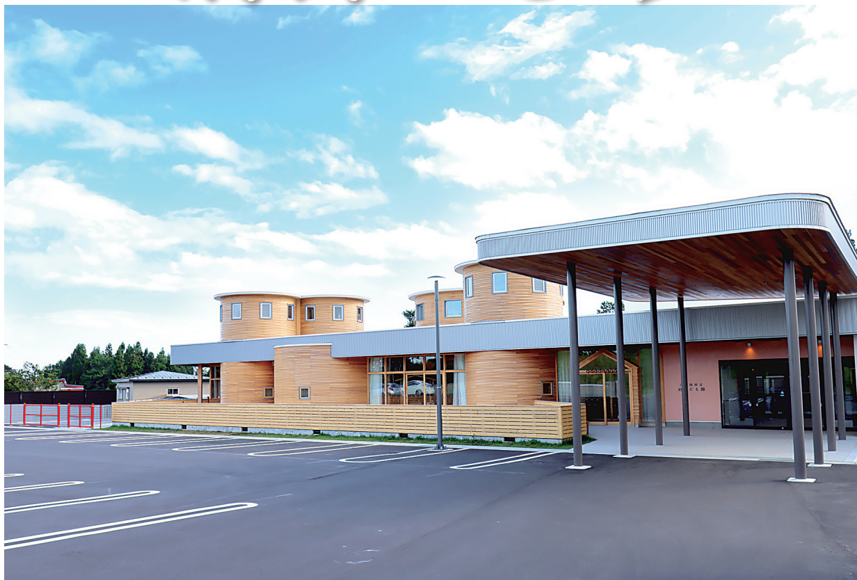
10月1日に供用開始された泊こども園