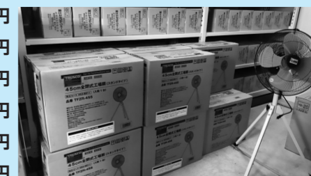
新型コロナウイルス感染症対策事業庁用器具費