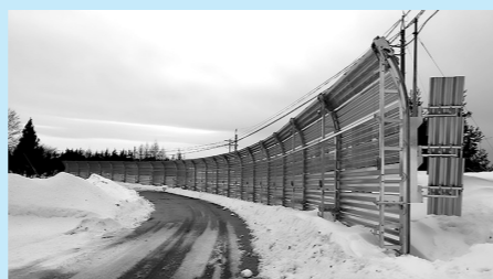
千歳・睦栄線防雪柵