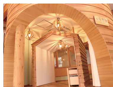
木育スペースの様子