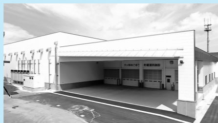
ごぼう貯蔵選別施設