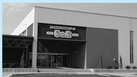
屋内温室プール「ろっぷ」