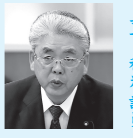
寺下 和光 議員

【問】①村民からの苦情の電話がある関係で、この雪害対策について、今年度の除雪事業に反映させたか。 ②排雪作業が遅れている原因は何か具体的に示せ。 ③今後とも多くなると思われる高齢者世帯に対して除雪対策について、どのような考えはあるか？