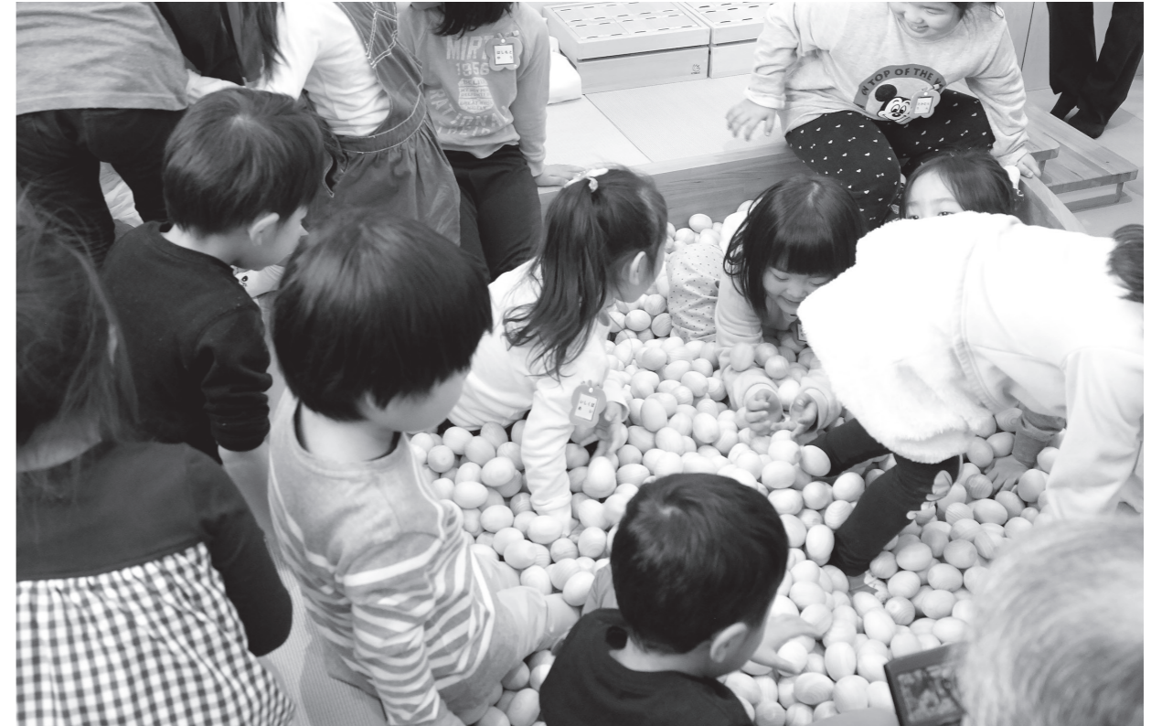
開園した南こども園で元気に遊ぶ園児の様子