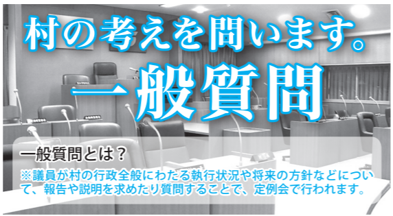
一般質問とは？ ※議員が村の行政全般にわたる執行状況や将来の方針などについて、報告や説明を求めたり質問することで、定例会で行われます。