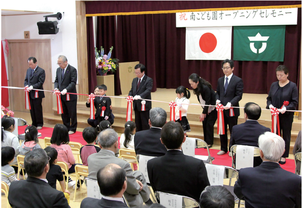
本年4月に開園した「南こども園」のオープニングセレモニーの様子（4月3日）