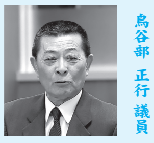
鳥谷部 正行 議員

【問】①村民からの苦情の電話がある関係で、この雪害対策について、今年度の除雪事業に反映させたか。 ②排雪作業が遅れている原因は何か具体的に示せ。 ③今後とも多くなると思われる高齢者世帯に対して除雪対策について、どのような考えはあるか？