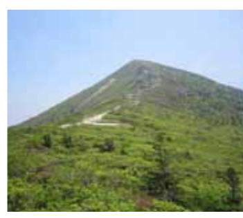
①襄陽郡の名峰「雪岳山」。斜度がきつくと、予想以上に難度が高い ②雪岳山の最高峰「大青峰」の頂上での一枚。付近の景色はとてきれいでした

あり、私はせっかくの機会だと思い大青峰に上るコースを選択しました。 当日は午前8時30分に出発、登山道は予想以上に斜度がきつくと、岩肌が露出。手をつかないと登れない所やロープに掴まりながら登らなければならぬ所も多く、数回の休憩を挟みながら12時過ぎにようやく頂上に着きました。当日はあいにく快晴ではなく、襄陽郡市内を見渡すことはできませんでしたが、頂上付近の景色はとてきれいでした。 下山は登ったコースとは別のコースを行きましたが、標高1000メートル付近を登ったり下ったりが続き、情けないことに最後の2キロくらいは膝が笑うような状態に。集合場所へ着いたのが午後5時30分、予想を遥かに超える大イベントになりました。 韓国では今、登山がブームとなっています。私が雪岳山に登った時も多くの登山者の人たちがす