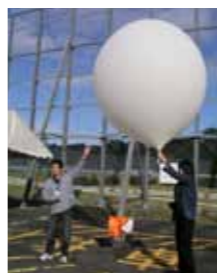
観測気球の放球の様子 (京都大学 MU レーダーサイトにて)

ヤマセの気象観測が、7月15日夜から8月7日夜までの週末を中心に開催されます。観測気球を使った上空の気象観測、レーザー光による雲や水蒸気の観測、音による上空の風の観測が行われます。