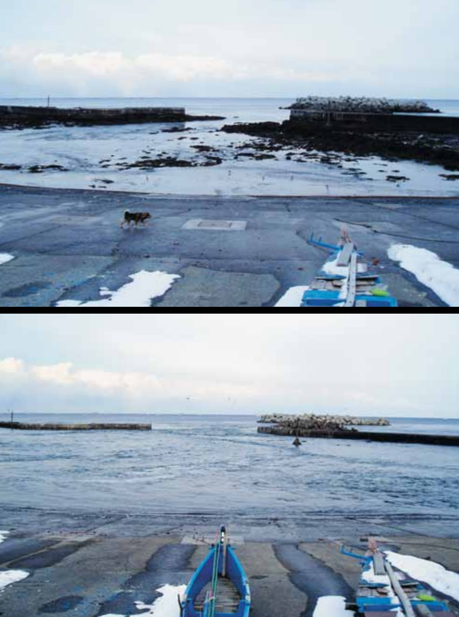
地震直後の白糠(泊地区)漁港(通称:間ノ口)の海面の変化。㊦ふだんは見えない岩肌が露出。「ゴーツ」という音とともに潮が引き、㊦間もなく津波が押し寄せた。この後津波はさらに高くなったという