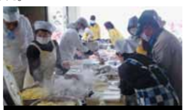
炊き出しの準備をするマークさんたち

野田村に着くと同時に目に飛び込んできたのは、ガレキの山でした。テレビでは見ていたものの、目の前