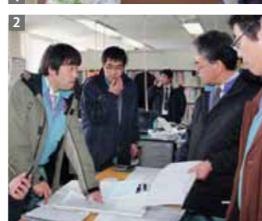
1_避難所となった第一中学校体育館。村内では10カ所の避難所に一時1,256人が避難。いくつかの避難所では、住民が食料などを持ち寄ったり、炊き出しをするなど、協力し合う姿が見られた(12日) 2_村原子力対策課で、停電や断水についての対応を話し合う職員たち(12日) 3_津波により壊れた高瀬川河口にかかる橋 4_津波で橋げたの法面が崩れ、折れた地域情報基盤の電柱(鷹架橋)