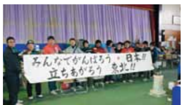
避難所の皆さんを激励する有志たち

何ができるか考えるだけでなく、行動をおこす。私たちは、これからも継続して、何らかの支援を続けていきたいと思っています。