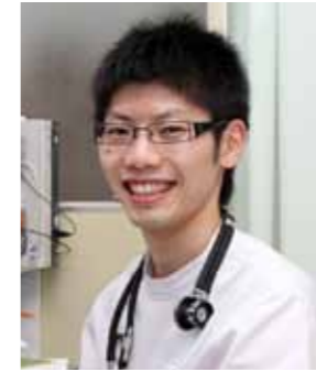
尾駮診療所 内科医長

師が不足します。最近では全国の医学部の定員が増え、これから免許を取得する医師がますます増えるでしょう。 しかし、偏在が生じる原因を改善しない限り、医師が不足していることは変わりません。 最近ようやく地域医療を担っている総合医やプライマリ・ケアなどという言葉が認識されるようになってきました。限られた臓器の病気だけではなく、幅広い健康問題を解決することができる総合医が増えれば医師不足はきつと改善するでしょう。 地方の医療だけではなく、都市部でも臓器ごとにかかりつけ医がいて、毎日違う病院に通うという事態が避けられます。