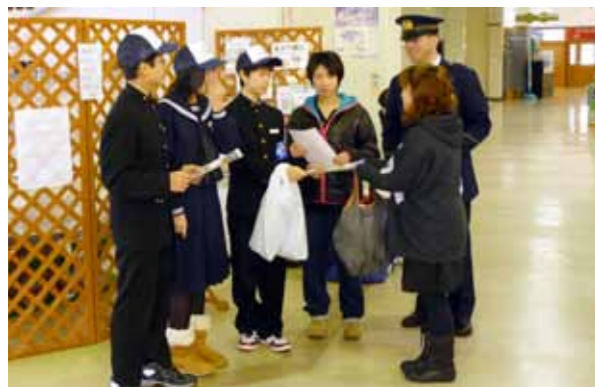
チラシとチョコレートを買ったお客に配る JUMP チームメンバー