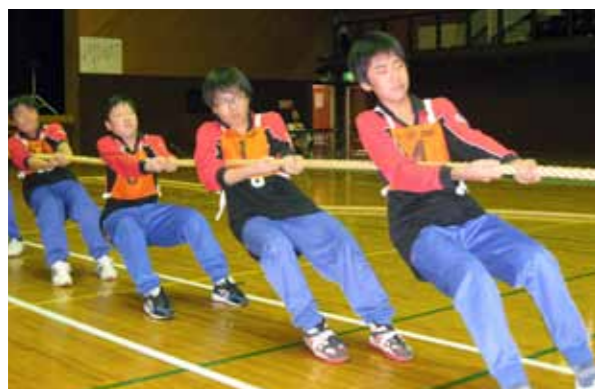
泊ジュニアチーム

第16回青森宝栄工業杯六ヶ所村綱引大会が2月13日、総合体育館で開かれ、一般やジュニアなど15チームが熱戦を繰り広げました。大会の開催は3年ぶり。試合は各部のリーグ戦形式で行われ、それぞれのチームが力を競い合いました。主催した同社の砂川誠工場長は「全国的に活躍する強豪チームからジュニアまで。各チームが熱いゲームを展開した。来年は他地区からも積極的に参加してほしい」と話していました。