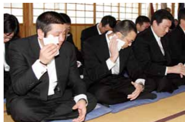
形代（かたしろ）で耳や目などを拭いて厄除けを祈願

泊地区伝統の合同厄払いが2月1日、諏訪神社と貴宝山神社で行われ、今年が大厄にあたる数え年42歳の男性8人が無病息災などを祈願しました。