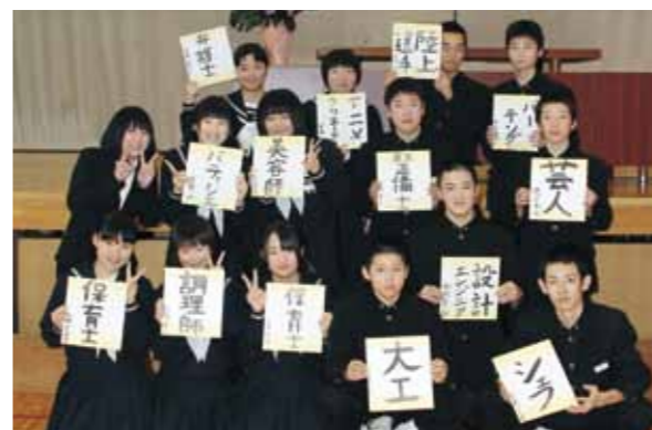
自分の夢を披露した生徒たち

千歳中学校の立志式が2月3日、同校の体育館で開かれ、2年生15人が将来の夢を力強く披露しました。