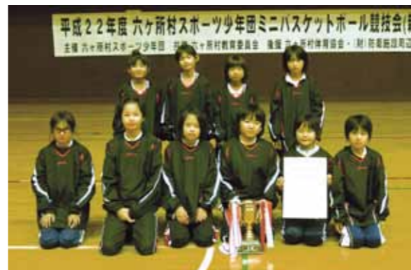
連覇を果たした尾駮ミニバススポ少のメンバーたち

平成22年度村スポ少ミニバスケットボール競技会（新人戦）と22年度村中学校女子バスケットボール大会（新人戦）が1月22日、総合体育館で開かれました。