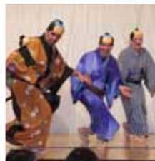
村派遣職員がヤンヤン郡での暮らしを紹介しています ④手料理が並ぶブース ⑤会場を沸かせた「水戸黄門ずっけ旅」

村内在住の外国人たちが自国の文化を紹介する異文化交流フェアが2月20日、文化交流プラザ「スワニー」で開かれ、来場者約400人が民俗舞踊のステージや各国の料理を楽しみました。 フェアは今年で7回目。今年は14カ国の外国人たちがブースを開き、母国の紹介や自慢料理で来場者をもてなしました。来場者たちは各国のブースを回って身振り手振りで会話したり、韓国民謡やイングランド舞踊などのステージを楽しんだりしていました。