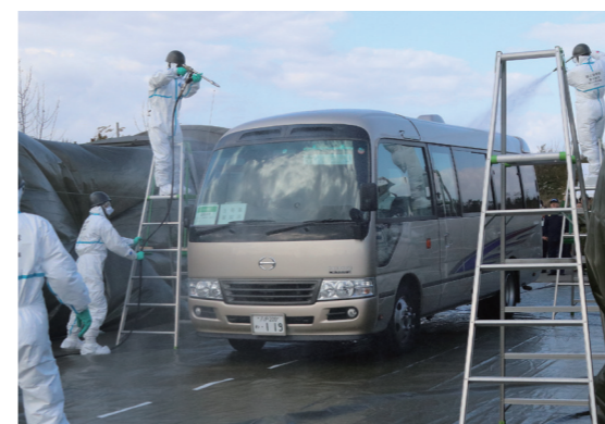
避難車両を流水で簡易除染する自衛隊

地震および津波災害と、東北電力(株)東通原子力発電所で事故が発生したことを想定した「平成 30 年度青森県原子力防災訓練」が県および村の主催で実施されました。