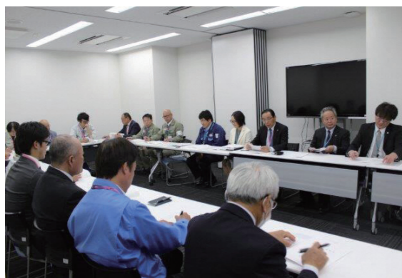
規約などの話し合いが行われる

弥栄平地区まちづくり協議会（立地企業 14 社所属）設立を記念して 10 月 30 日、総会と式典が(株)ジェイテックの会議室で行われました。