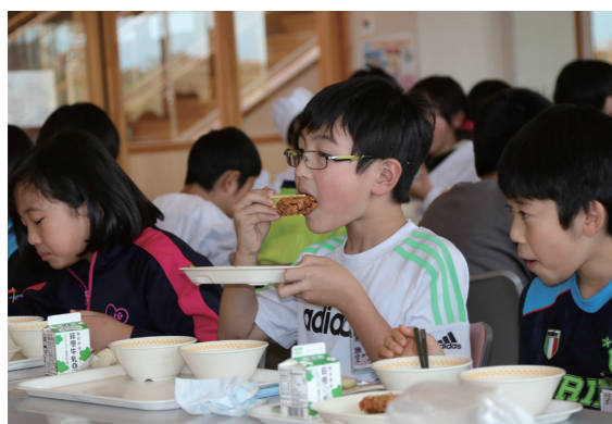
ごぼうメンチをほおぼる児童

村学校給食センターは 11 月 5 日を「ふるさと産品給食の日」として、村内全ての小中学校の給食で六ヶ所ごぼうメンチを提供しました。