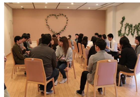
和やかな雰囲気自我介绍が行われた

村の既婚率や出生率向上を目指して、出会いの機会を提供する婚活支援事業「六恋祭 恋の収穫祭！！運命の人の心つかみ取り！！」が 10 月 27 日、スパハウスろっかぼっかで開催されました。