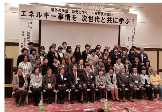
フォーラム参加者たち

エネルギーを考える未来塾主催の「県外の学生、県内の学生、一般市民の集い！エネルギー事情を次世代と共に学ぶ！」フォーラムが 10 月 6 日、文化交流プラザスワニーで開催されました。