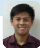
タカログ語はニニヨ!

日本とフィリピンで両国に共通していることが、ひとつあります。それは、どちらの国も卒業式は3月に行われる、ということです。フィリピンでは、Pagtataposと呼ばれる卒業式が行われ、とても忙しい時期です。学生たちは、長い学校生活から開放される喜びの一方で、クラスメイトや先生たちと別れを惜しむ、そんな気持ちを象徴する甘くせつないひと月ですね。そして3月は、ゴールでもあり、同時にスタートでもあります。今、あなたが行っていることは、未来のあなたを作っています。つまり、未来の自分は、今の自分の延長線上にいるということ、どうか忘れないでください。この3月に卒業する皆さん、ご卒業おめでとうございます!