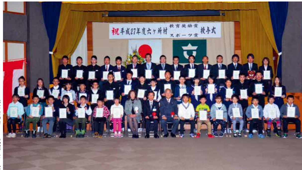
◇スポーツ賞を受賞された皆さん◇