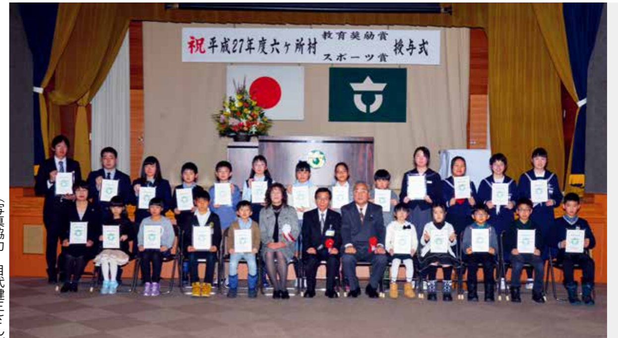
◇教育奨励賞を受賞された皆さん◇