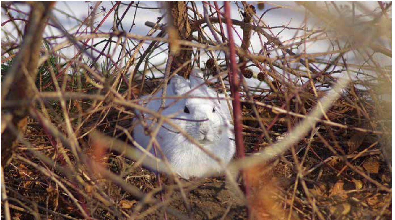
早春の朝、雪が融けた道路脇で気持ちよさそうに日向ぼっこをしていました

地面が雪に覆われる冬場、ウサギの体は、耳の先を残して真っ白になります。このため、じっとしているウサギを見つけることは、非常に困難です。そして体の色が茶褐色になる夏場は、比較的見つけやすいです。