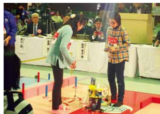
自作のロボットで奮闘中

第17回青森県・げんねんジュニアロボットコンテスト（日本原燃㈱主催）が2月13日、大石総合体育館にて行われ、県内13市町村の少年少女発明クラブと少年少女アイデアクラブの小中学生が自作ロボットで白熱した試合を繰り広げました。