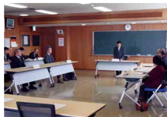
意見交換が行われている様子

中央公民館会議室において1月20日、村長、教育委員会教育長および教育委員が会し「第1回六ヶ所村総合教育会議」が開催されました。