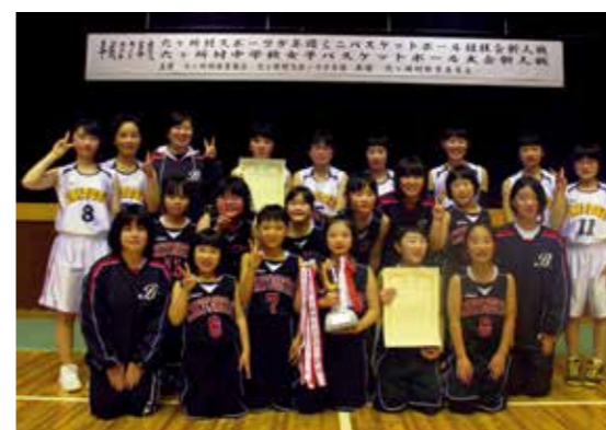
優勝したちとせたい bits と千歳中学校のメンバー

「平成27年度六ヶ所村スポーツ少年団ミニバスケットボール競技会新人戦」と「平成27年度六ヶ所村中学女子バスケットボール大会新人戦」が1月30日、大石総合体育館で開催され、選手達が熱い戦いを繰り広げました。