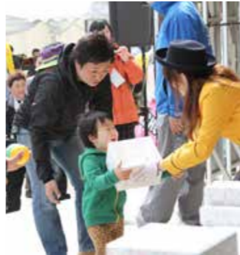
ピンゴ大会の景品に笑顔がこぼれる