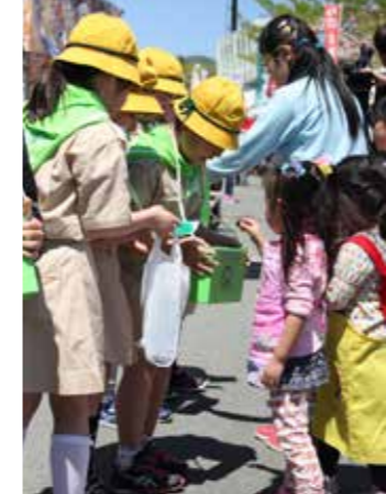
みどりの少年団による募金