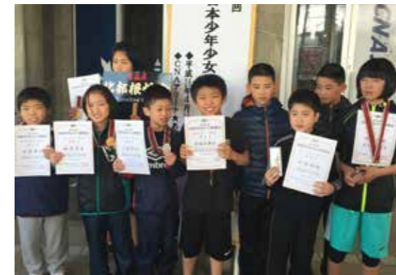
大会終了後の選手たち

第33回北日本少年少女レスリング選手権大会が4月29・30日の2日間、秋田市立体育館で開かれ、北海道から新潟までの38チーム、415人出場しました。