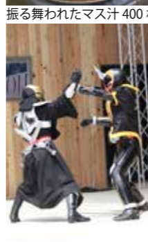
「仮面ライダーゴースト&ドライブショー」大きな声で「ゴースト頑張れ〜」