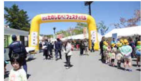
たくさんの方で賑わいを見せる