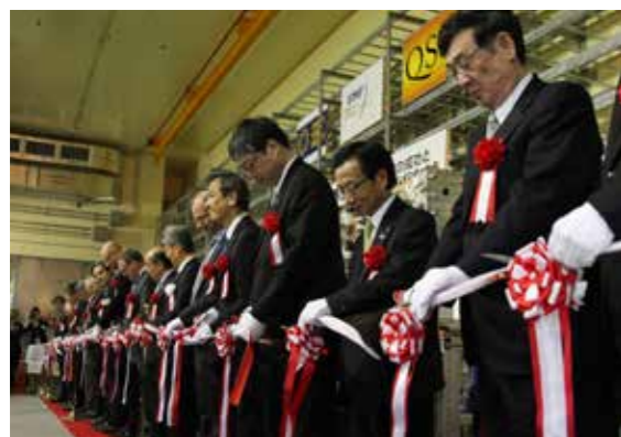
式典でテープカットを行う関係者たち

国際熱核融合実験炉 (ITER) の関連研究に伴う IFMIF 原型加速器の入射系ビーム加速実験の成功と高周波加速器/高周波源の据付開始を披露する記念式典が4月21日、量子科学技術研究開発機構六ヶ所核融合研究所で行われ、国内外から関係者約150人が出席しました。