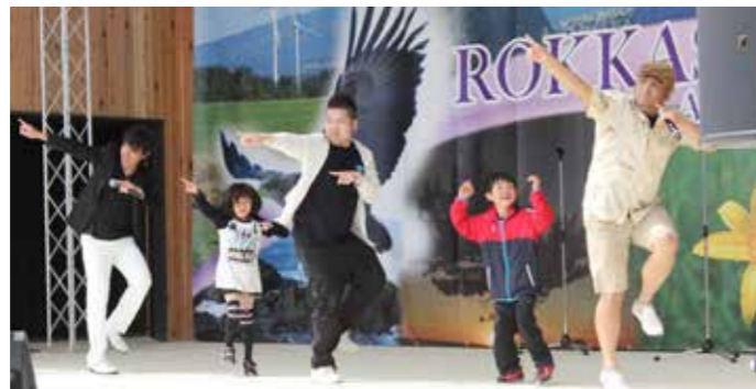
ダブルネームと一緒に子どもから大人まで知っているランニングマンを披露