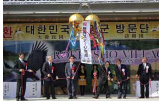
屋外ステージ完成を祝いくす玉が割られる