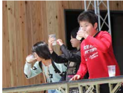
「ビタッと飲んで六趣・ミルクで乾杯！」