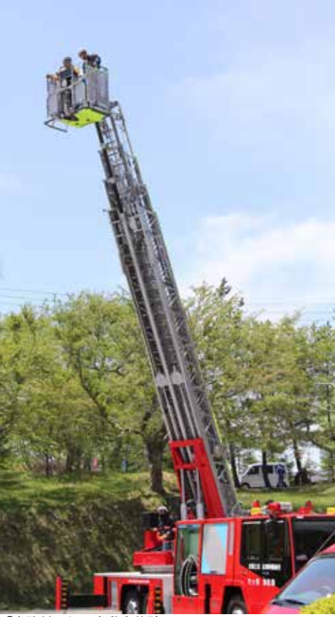
「水路付はしご自動車体験」