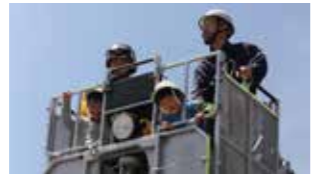
はしご車の高さを体験「たか〜い」