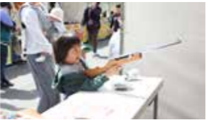
屋台では射的に挑戦！