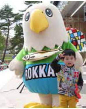
ロクジローと一緒に記念撮影