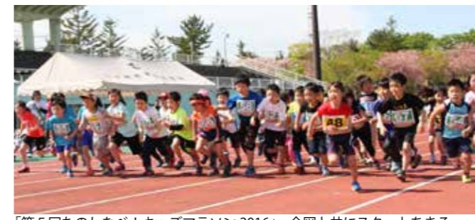
「第5回たのしむべ！キッズマラソン2016」 合図と共にスタートをきる