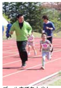
ゴールまであと少し...