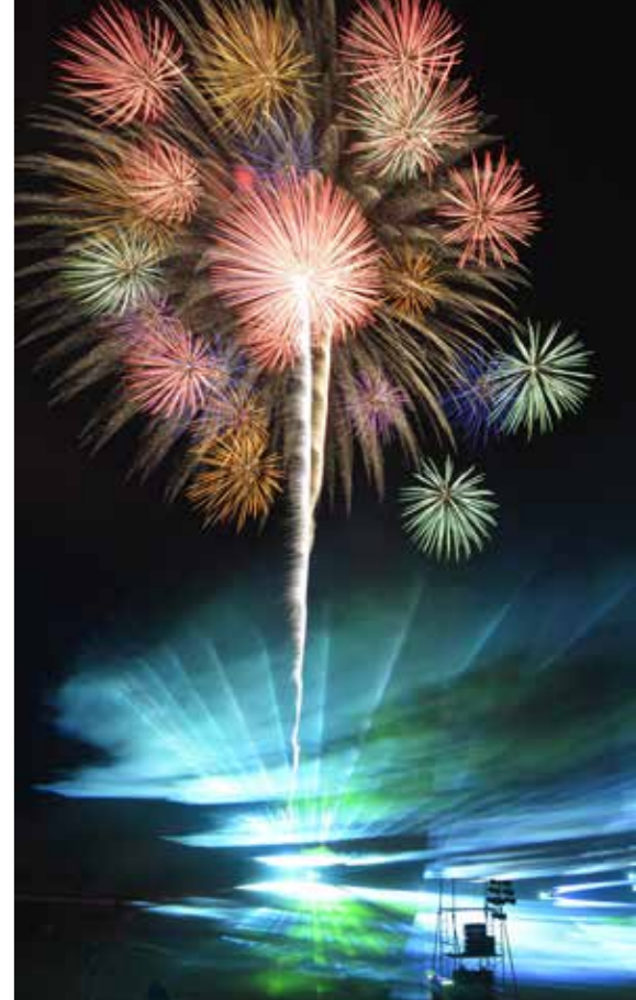
「花火とレーザー光線と音楽の共演」