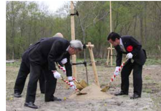
植樹を行う出席者たち

第23回鹿六会植樹祭が4月26日、市柳総合公園で行われ、会員や関係者など約50人が参加しました。