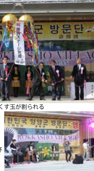
アマチュアバンドオンステージ