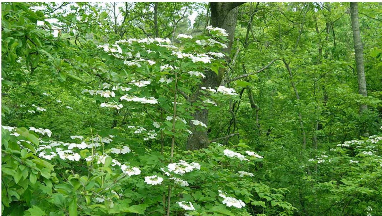
ヤマセ霧の合間に姿を見せたカンボク

木々の間に何かが在る。何かが森全体を守っている。ヤマセ霧に包まれた緑の森の中にカンボクが白く浮かんで咲いている。森の精霊がその葉先に宿っている。森に入り込んだ足先から、木々の揺き分けた手の先から、緑に染まっていく。そして、森に宿る精霊がわが身と一体化する。