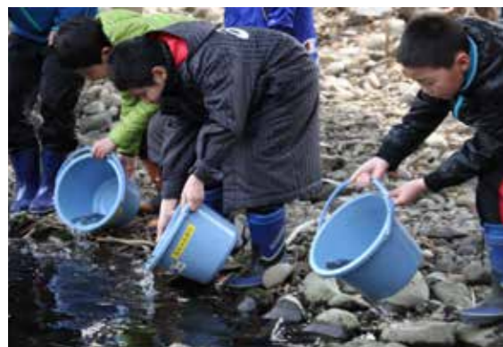
老部川へさけ稚魚を放流する尾駮小学校の児童たち

平成28年度六ヶ所村さけ稚魚放流事業が4月13日と15日に行われました。この事業はさけの捕獲量増加と小学生の漁業への関心を高めるため毎年行われています。