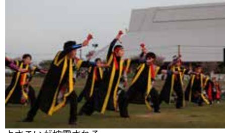
よさこいが披露される