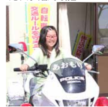
かっこいい白バイにまたがり、にこり