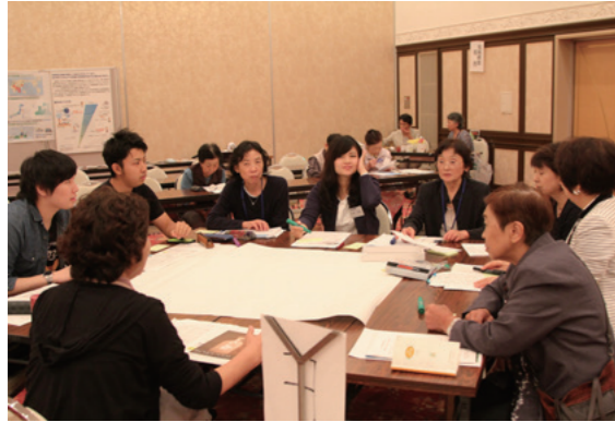
塾生や学生によるワークショップ

「エネルギー事情を次世代と共に学ぶ！ー首都圏の学生、地元の学生、一般市民の集い！」が9月3日、スワニーで開催され、約80人が日本のエネルギー事情について理解を深めました。