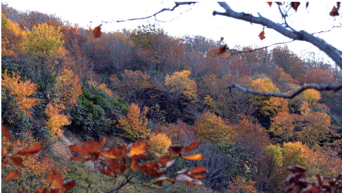
林道脇に転々と黄色をちりばめて秋を迎える木々

遠くに見える吹越烏帽子の山々が秋色に染まる。ブナやミズナラの黄褐色の林に、青森ヒバの緑とヤマモミジの紅色がモザイク状に塗りこめられる。山間の林道脇に雲間から光が差すと、オオバクロモジやコシアブラのレモン色の紅葉がひとときわ輝いて浮き立つ秋が香る。