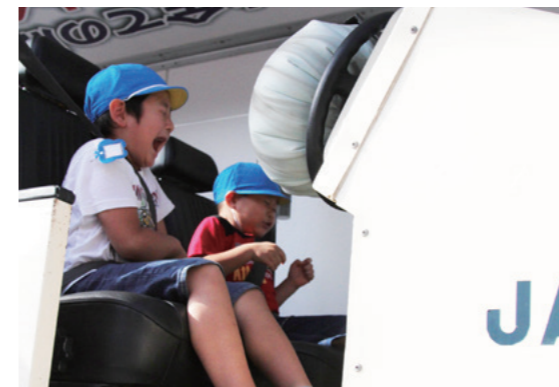
シートベルトコンビンサーを体験する園児

交通安全青森県キャラバン隊によるメッセージ伝達式と交通安全教室が9月1日に開催され、おぶちこども園の園児と保護者約60人が参加しました。この活動は交通安全意識の末端浸透をはかることを目的に青森県交通安全母の会連合会が行っています。