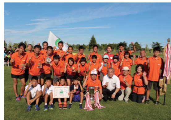
六ヶ所村県民駅伝チームの皆さん

第24回市町村対抗青森県民駅伝競走大会が9月4日、青森市で開催され、六ヶ所村県民駅伝チームが村の部優勝に輝きました。