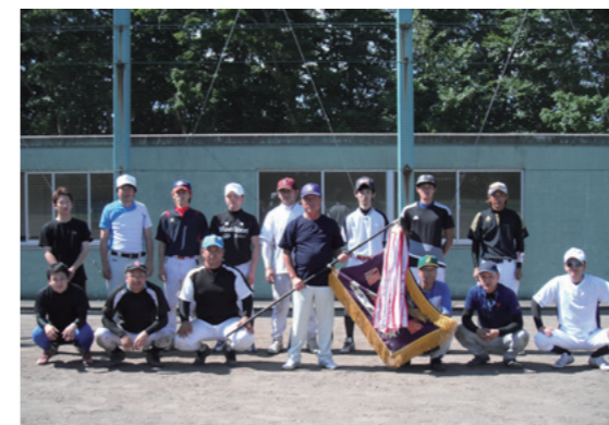
優勝を飾った倉内チームの皆さん

第39回六ヶ所村長旗争奪町内対抗野球大会が8月11日、大石総合運動公園第三球場で行われました。