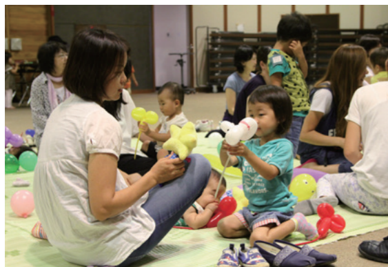
親子で人形と風船で遊んでいる様子

「親子でパペットワークショップーみてみよう！やってみよう！人形劇ー」が9月7日、中央公民館で行われ、13組の親子が参加しました。このワークショップは親子すくすくスキンシップ事業の一環で、さまざまな体験を通じて親子のスキンシップを図ることを目的に行われています。