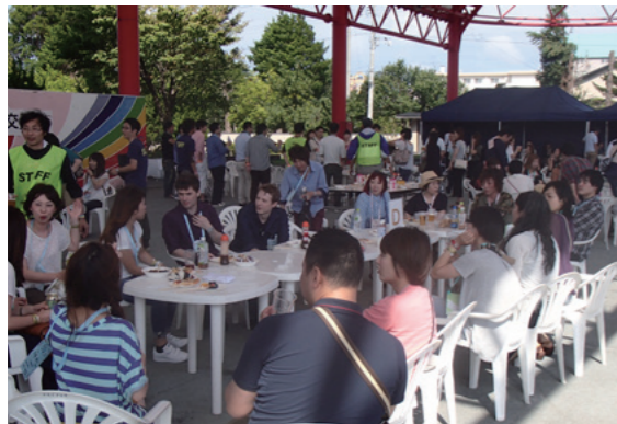
グループ交流で会話を弾ませる参加者たち

三沢市ミスビードルドームにおいて9月3日、今年度2回目となる「独身者交流会」が開催されました。交流会には六ヶ所村産業協議会に関係する男性約55人、村および近隣市町村から女性約60人が参加しました。