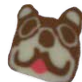
クマのくじらもち