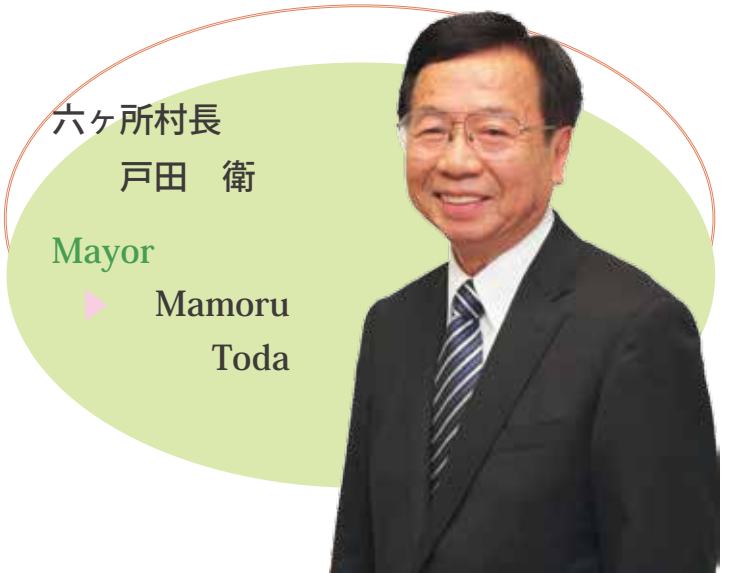
六ヶ所村長 戸田 衛 Mayor Mamoru Toda

試験の開始や共同研究棟の建設が示されるなど原型炉に向けた研究活動の着実な推進を願っております。