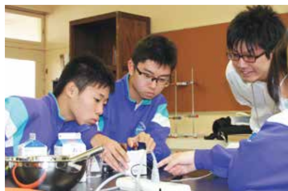
学生⑤の指導を受け、ステンレス板に電気プラグを装着する生徒たち