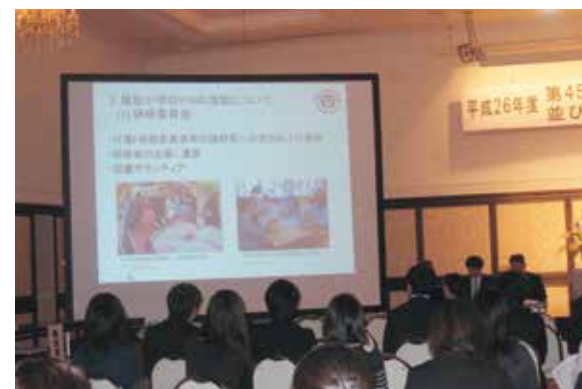
尾駮小学校PTAによる活動実践事例の発表

「第45回六ヶ所村学校保健研究大会並びに六ヶ所村連合PTA研究大会」が11月15日、スワニーで開かれ、学校関係者や保護者など約50人が参加しました。