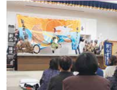
新山権現保存会による信夫（しのぶ）