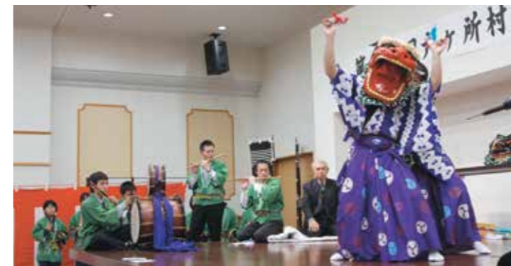
平沼神楽保存会による神明舞