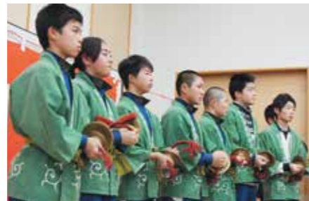
平沼子供神楽会による下舞・権現舞