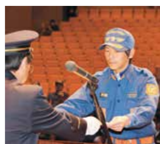
賞状を受け取る団員(表彰)