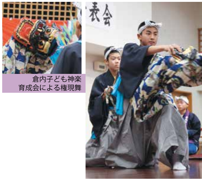
倉内子ども神楽育成会による権現舞