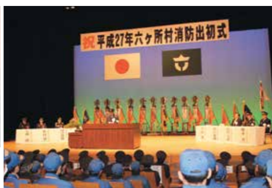
戸田村長による訓示→