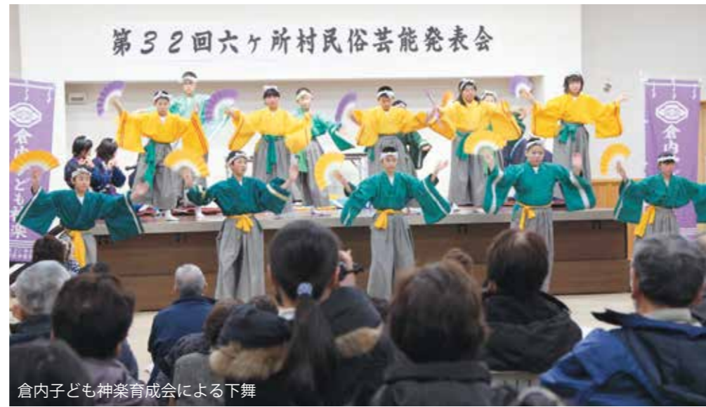
倉内子ども神楽育成会による下舞