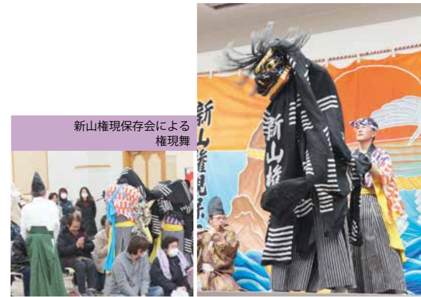
新山権現保存会による権現舞