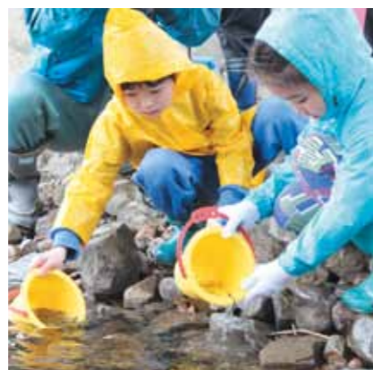
稚魚がびっくりしないように、そつと放流してあげようね（尾駁小）