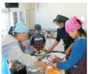
親子で楽しく朝食づくり

子どもをつくる朝食づくりを行いました。当日は6グループに分かれ、チーズおにぎりやアスパラベーコンとカレー炒めなどを作りました。