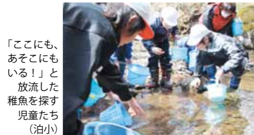
「ここにも、あそこにもいる！」と放流した稚魚を探す児童たち（泊小）