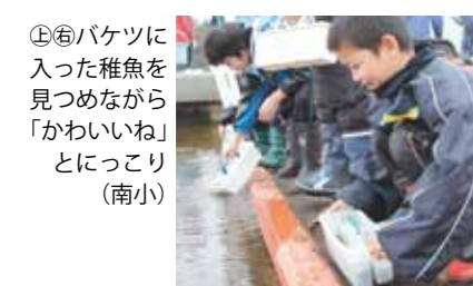
④⑤バケツに入った稚魚を見つめながら「かわいいね」とにっこり（南小）