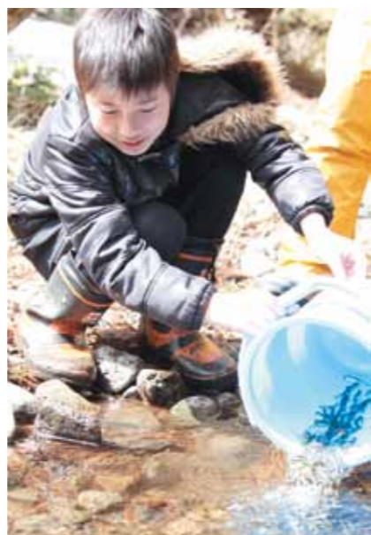
優しく放流する児童（泊小）