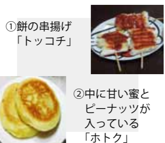
①餅の串揚げ「トッコチ」

作り方はとても簡単で面白く、子どもたちにも楽しい経験になると思います。親子で一緒に韓国料理を体験してみませんか。