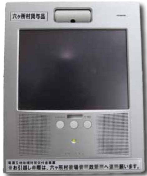
各家庭にある防災告知端末