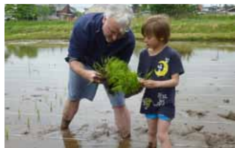
泥だらけになりながら一生懸命植えました