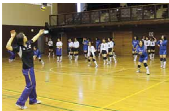
日立リヴァーレの選手からレシーブ指導を受ける児童たち

第 18 回六ヶ所村バレーボール教室が 6 月 9 日、六ヶ所村立総合体育館で開催され、村内外の小中学校の児童生徒 75 人が「日立リヴァーレ（茨城県ひたちなか市）」の選手から実技指導を受けました。