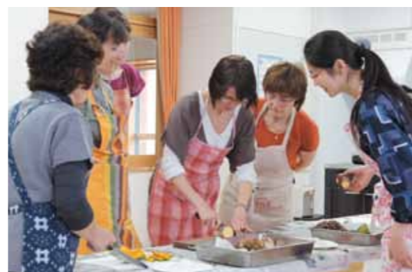
和食料理教室の様子

外国人を対象とした和食家庭料理教室が 5 月 28 日、国際教育研修センターで実施されました。