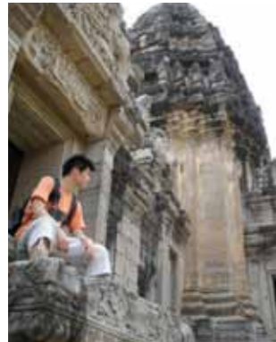
ヒマーイ遺跡(タイ)にて

がしっかりとしていないと疾病にもなつてしまう。こうみると、その人の「健康」についていろいろな事柄が共に絡み合つてできてつて、思いませんか。 僕は東京生まれですが、幼少時から高校までを海外で過ごしました。大学は東京でしたが、その後は静岡県、そして今年から六ヶ所村に来ました。青森県には研修医の時に尾駮診療所へ3カ月ほど勉強に来たのが初めてで、改めてもつと勉強したいと思ひ、働く機会をいただきました。働くようになった自分が言うのもなんですが、尾駮診療所のスタッフは皆さんとても優秀で熱心で、思いやりがあります。その証拠に全国から毎年多くの研修医や学生が学びに来ます。 検討会や勉強会も、毎日やっている診療所は全国探しても数えるほど