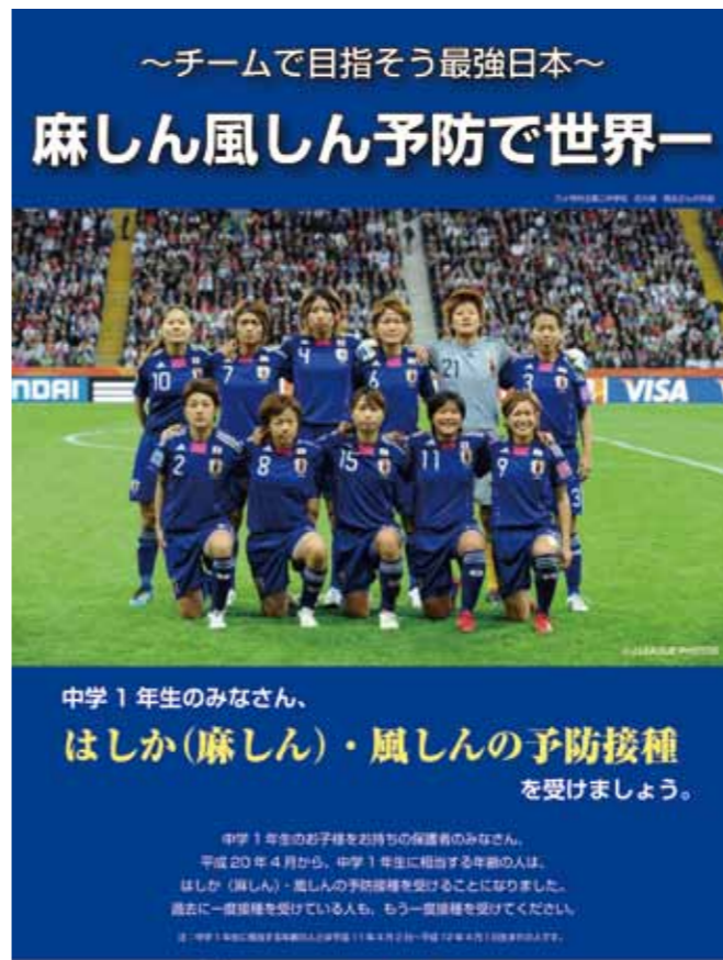
石久保くんのキャッチコピーが掲載されたポスターは日本全国の学校で掲示されています

麻疹(はしか)のウイルスに感染すると、約10～12日間を経て、熱・せき・鼻水などの症状が出現します。数日すると、首すじ・顔から赤い発疹(ぶつぶつ)が出現し、高熱となり発疹は全身に広がります。38～39℃の熱は1週間から10日程度続くことがあります。とてもうつりやすく、免疫がないと大人もかかります。