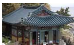
【襄陽郡にある洛山寺にある建物】 ①海辺にある仏殿「紅蓮庵（ホンリョナム）」。床から下をのぞくと海が見えます ②高さ16mの「洛山寺海水観音像」は、韓国の三大観音聖地として有名

儒教の教えについては、「孝」を重んじる傾向があり、目上の人を尊重します。実際にこの教えは人々の生活に深く浸透していて、バスや電車内ではどれだけ混んでいても必ず席を譲るなど、他人であっても年配の人を大切にする精神は日本よりも強く感じられ、私自身、学ぶ点が多いと感じさせられました。