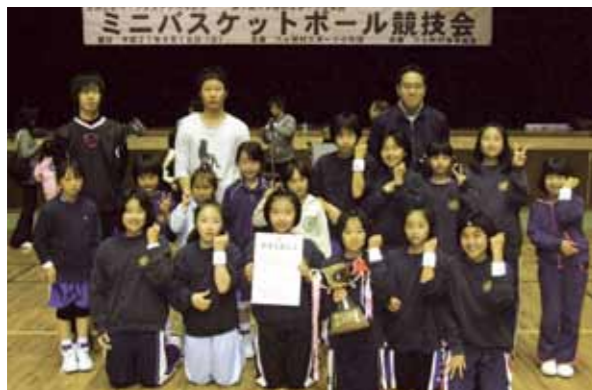
優勝した「千歳平スポーツ少年団」メンバー

「第1回六ヶ所村スポーツ少年団ミニバスケットボール競技会」が5月10日、村立総合体育館で開かれました。