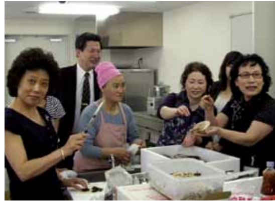
ホタテ貝焼きなどをつくる参加者たち