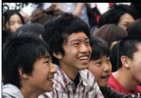
1. 力強い舞、よさこいフェスティバル 2. 120kgのマグロの解体ショー。迫力満点! 3. お笑いステージでは笑い声が絶えませんでした 4. 多彩な出店が立ち並んだ味わい横丁 5. 会場はたくさんの子どもの元気な声が響いていました