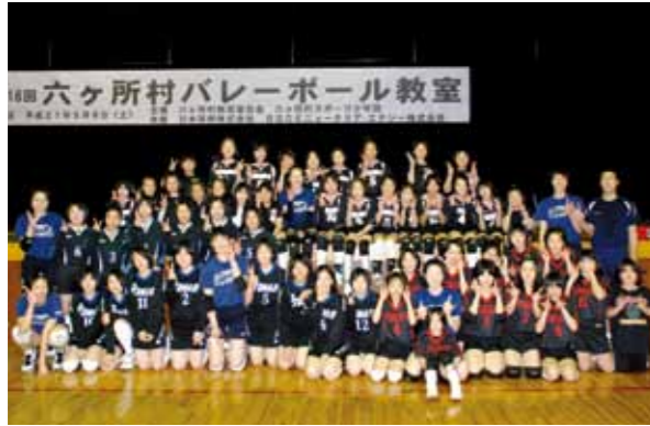
バレーボール教室参加者

「第16回六ヶ所村バレーボール教室」と「第1回六ヶ所村スポーツ少年団バレーボール競技交流会」が5月9日、村立総合体育館で開かれました。