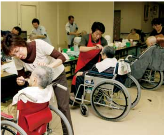
月曜会のメンバーがカットを行うフロア。いつも会話の絶えない和やかな雰囲気

特 別養護老人ホーム「ぼんてん荘」でヘアカットのボランティアを行う「月曜会」(高田正昭会長、メンバー9人)。1995(平成7)年に発足、今年15年目を迎えた。2カ月に一度、