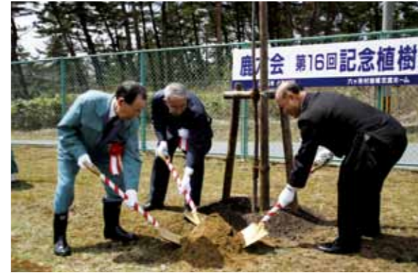
記念植樹をする(左から)古川村長、附田会長、高橋顧問