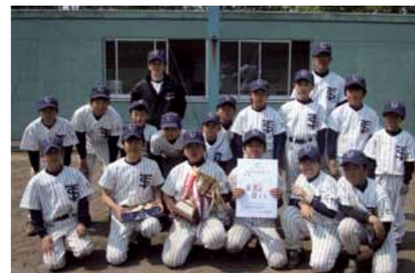
優勝した「泊スポーツ少年団」メンバー

「第19回王杯争奪野球大会」が5月9日、大石総合運動公園の本球場と第3球場で開かれました。