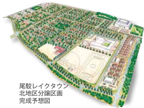
尾駱レイクタウン 北地区分譲区画 完成予想図