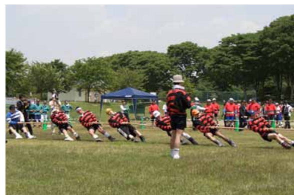
渾身の力を込めて綱を引く選手たち

六ヶ所村綱引協会「青森山海クラブ」が5月28日、栃木県大田原市で開かれた『全日本アウトドア綱引選手権大会』で640kg級で準優勝、560kg級で優勝しました。