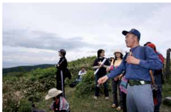
山頂からの眺めを楽しむ参加者たち

郷土館主催事業の「六ヶ所村歴史散歩・吹越烏帽子岳登山」が6月13日に行われ、村内外から16人が参加しました。