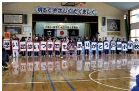
"メッセージカード"で戸鎖小への感謝を表しました

戸鎖小学校、戸鎖へき地保育所と戸鎖地区による「合同大運動会」が6月7日、同小の体育館で開かれました。