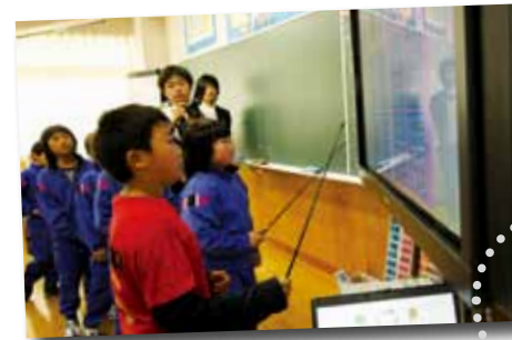
泊小学校「電子情報ボード」導入見学会(6月3日)

47都道府県の位置や県庁所在地について、クイズ形式で次々とテンポ良く答えています。これを超えるうちに、白地図を見ながら指摘できるようになります。これからは、テレビのニュースなどに県名が出てきたところで、すぐに位置をイメージすることでしょう。大人も負けそうでは?