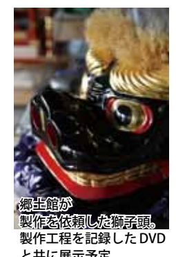
郷土館が製作を依頼した獅子頭。製作工程を記録したDVDと共に展示予定

獅子頭は、整形、塗り、磨きなど14種類の工程を経て、3カ月ほどで完成する。もちろん設計図はない。さまざま特徴を持つ獅子頭を頭の中で立体的にイメージし、下絵を木にマジッ