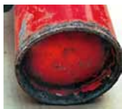
底がさびてはがれている。取っ手がさびているなどの消火器は使用しないでください

②このような消火器は絶対に使用しないでください 底がさびてはがれている。取っ手がさびているなどの消火器は使用しないでください