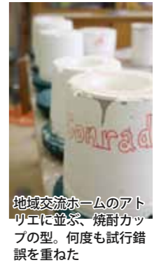
地域交流ホームのアトリエに並ぶ、焼酎カップの型。何度も試行錯誤を重ねた

村へ来てからは、地域交流ホームの陶芸室が彼のアトリエとなっている。「僕の創作活動に協力してくれる、ホームの職員や村職員の皆さんに感謝。アメリカに帰る前に、個展を開いて恩返ししたい」 そう言って、棚に並ぶ作品たちに優しく目を向けた。