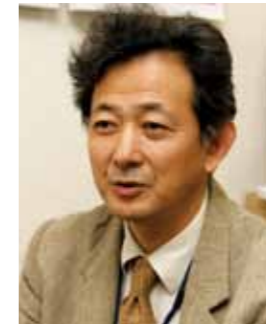
千歳平診療所長・健康づくり対策室長

「麻薬」大麻・マリファナ(乾燥大麻)・ハシッシュ(大麻樹脂)、ヘロイン・モルヒネ・アヘン・けし、コカイン(クラック)、マジックマッシュルーム 「違法ドラッグ」MDM