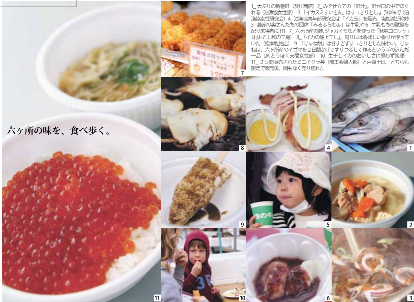
1. 大ぶりの新巻鮭(及川商店) 2. みそ仕立ての「鮭汁」。鮭が口の中でほぐれる(白魚協女性部) 3. 「イカスミすいとん」はすっきりとしょゆ味で(白魚協女性研究会) 4. 白魚協青年部研究会は「イカ玉」を販売。塩加減が絶妙 5. 農家の奥さんたちの団体「みるふらわあ」は牛乳や6. 牛乳もちの飴食を配り来場者にPR 7. 六ヶ所産の鮭、ジャガイモなどを使った「秋味コロッケ」(村おこし和の工房) 8. 「イカの船上干し」。周りには香ばしい香りが漂っていた(松本乾物店) 9. 「じゅね餅」は甘すぎずすっきりとした味わい。じゅねは、六ヶ所産のイゴマを2日間かけてすりつぶして作るという手の込んだ一品(UAとうほく天間女性部) 10. 生干しイカのおいしさに思わず笑顔 11. 2日間販売されたミニイクラ丼(商工会婦人部)と戸鎖そば。どちらも限定で販売後、間もなく売り切れた