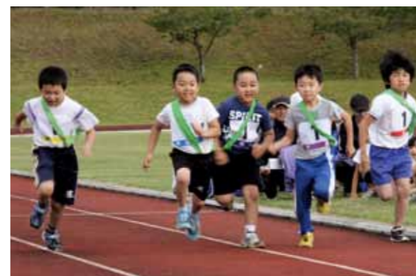
力強くスタートを切る第 1 区(小学校 1 年男子)の子どもたち

「第 26 回六ヶ所村子ども会駅伝競走大会」が 10 月 3 日、大石総合運動公園で開かれました。