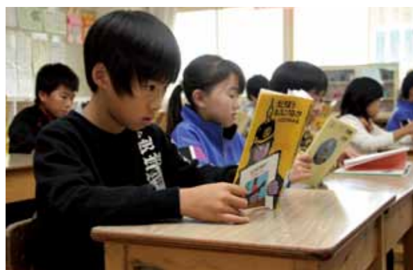
読書に集中する 3 年 1 組の児童たち

村制施行 120 周年特別事業「図書購入」で、村内の幼稚園・保育所・小中学校に一人 1 冊の本が贈られました。