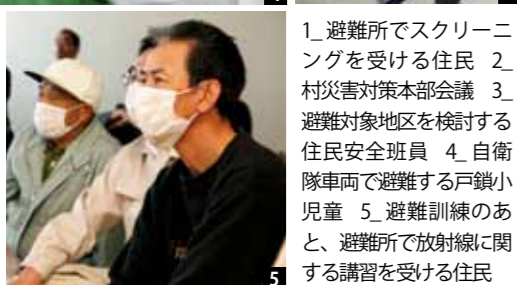
1 避難所でスクリーニングを受ける住民 2 村災害対策本部会議 3 避難対象地区を検討する住民安全班員 4 自衛隊車両で避難する戸鎖小児童 5 避難訓練のあと、避難所で放射線に関する講習を受ける住民

「青森県原子力防災訓練」が10月21日、六ヶ所村で実施されました。再処理工場での臨界事故を想定した今回の訓練には、国・県・村・防災関係機関と村民など、約50機関から約320人が参加しました。