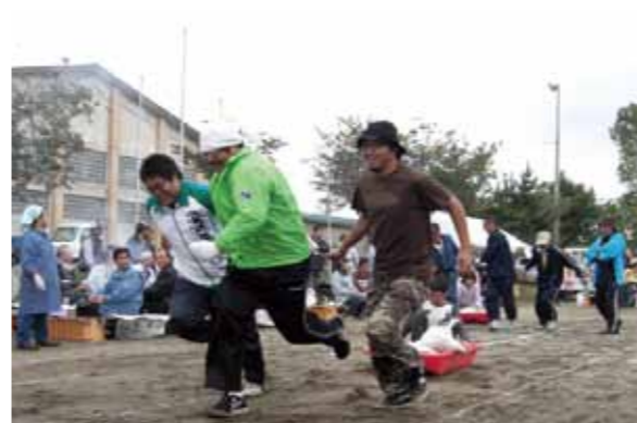
そりに人を乗せて早さを競う競技会も行われました

「第 8 回倉内秋の収穫祭」が 10 月 4 日、倉内小学校のグラウンドで開かれました。同祭には地区住民約 300 人が参加し、多彩な催しを楽しみました。