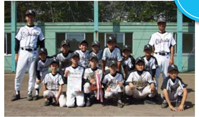
2大会を制した「千歳平スポーツ少年団」