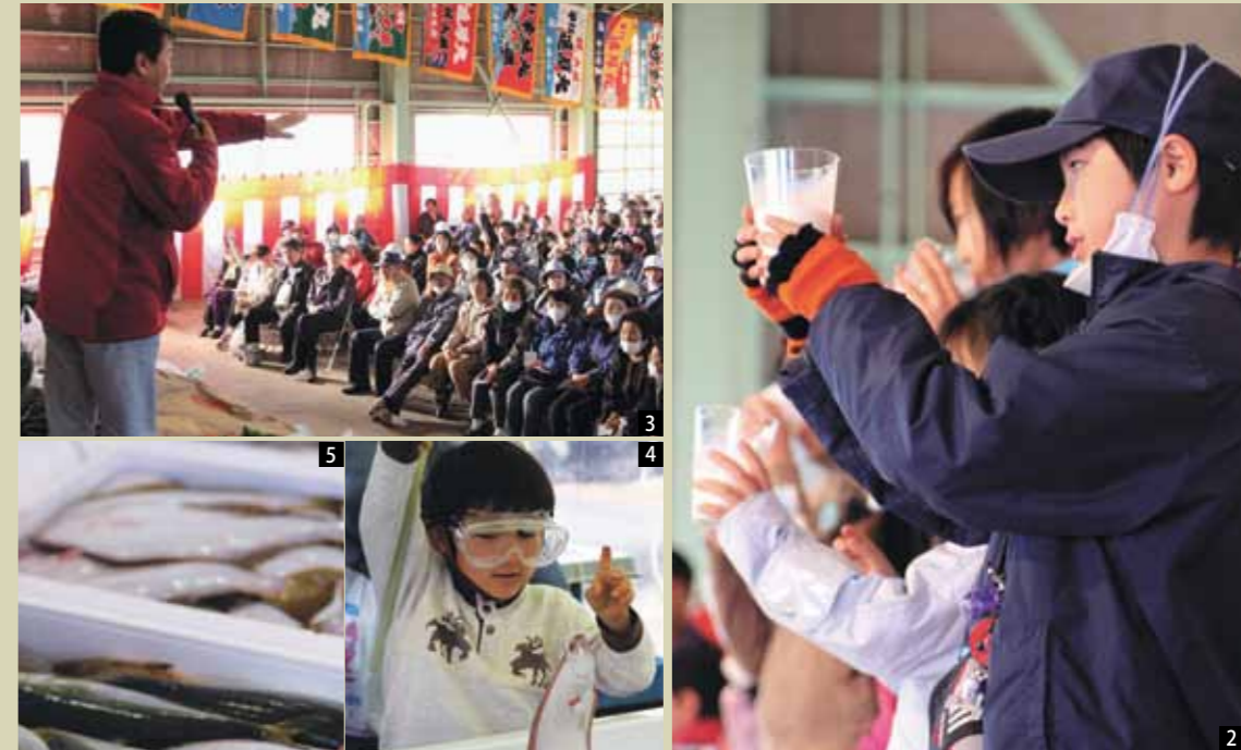
1. 2日間とも晴天に恵まれた産業まつり。多くの来場者でにぎわった 2. 120mlまでもう少しかな...? 「ピタッ!と飲んでミルクで乾杯」 3. ふるさと新鮮市では、新鮮な5. フラサや長イモなどの野菜を販売。新鮮なヒラメが2匹で500円という驚きの安さ 4. 釣果は大きなヒラメ! 「釣り吉三平に挑戦(白魚協)」 6. 幅広いジャンルの歌を聞かせてくれたRock趣〜s 7. いろんな種類のお菓子が並んだ松緑福祉会のブースで。選ぶのも楽しい 8. 毎年、ボランティアで産業まつりの会場のごみ拾いをしてくれる尾駮スポーツ少年団の団員たち。彼らも、陰でまつりを支えている 9. 力強く華麗なバチさばきを見せた「札付打太鼓」のパフォーマンスショー