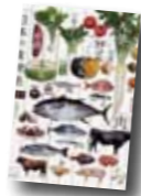
日本の食材帖 山本謙治監修

高校の教科書「日本の歴史(改訂版)」をベースに、一般の読者を対象に記述を見直し、時代に即応した簡潔かつ明確なうちに書き改めた通史。現代の理解の手助けとなるテーマを選んで解説したコラムも掲載。