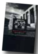
エジプト発掘 解き明かされる4つの謎 NHK編

天気のメカニズムから防災まで。知っておきたい身近なお天気の知識を、気象庁天気相談所元所長と、現役理科教師が判りやすく解説。天気の時間変化を動的に見る「ばらばら衛星画像」も掲載します。