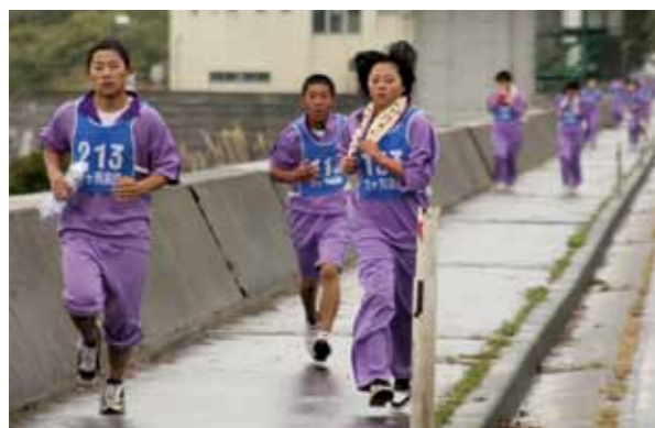
冷たい雨の中を力走(鷹架橋)

六ヶ所高校(安保敏彦校長、生徒数 189 人)全校生徒による「六ヶ所縦断耐久レース」が 10 月 9 日に行われました。