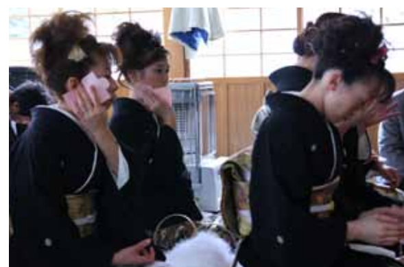
形代（かたしろ）で目や耳などをなでる参加者

平成22年が大厄の年にあたる男女による厄払いが2月1日、泊地区の神社で行われました。この厄払いは古くから泊地区で行われているもので、今年は男性11人と女性5人が参加、諏訪神社や貴宝山神社や稲荷神社などでお払いを受けました。