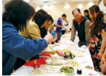
左 「中国ブース」では、水餃子やサラダなどテーブルいっぱいの料理でもてなした

「異文化交流フェア 2010」が2月21日、文化交流プラザ「スワニー」で開かれました。今回で6回目となる同フェアには、村内在住の外国人が過去最多の11カ国のブースを設置。各国自慢料理の香りが漂う会場に、多くの来場者が訪れました。 中国ブースでは、餃子やサラダなど日本でもなじみの料理が並び、インドブースでは4種類の香