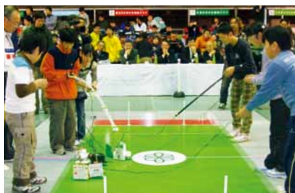
中級部門「ロボエッグ」で健闘した「カクカクシカジカ」チーム

「第11回げんねんジュニアロボットコンテスト」が2月13日、六ヶ所村総合体育館で開かれ、県内14発明クラブ約300人が力作のロボットで競い合いました。