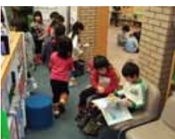
好きな本を手にとり、興味深そうに読む子どもたち

今回の訪問は「読書は心を暖める」がテーマの読書週間中。子どもたちの心もポカポカ気分になったのでしょうか。ぜひまた来館してくださいね。