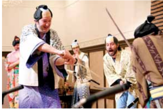
上 コミカルな演技で来場者を笑わせた「水戸黄門ずっこけ旅」