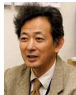
千歳平診療所 所長

暖かくなると、白アリが何千匹も「羽蟻」となって舞い飛び、窓際の狭い空間を占領。冬は玄関の内壁が結露し、下の方は水浸しで大変でした。そんなこんなで、ここ