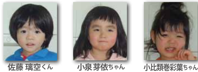
今月の歯ッピーエンゼルたち● 1月21日の3歳児健診で虫歯のなかった子どもたち