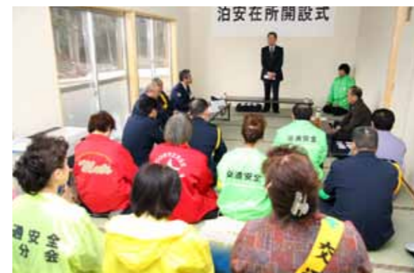
関係者が出席し、開設式が行われました