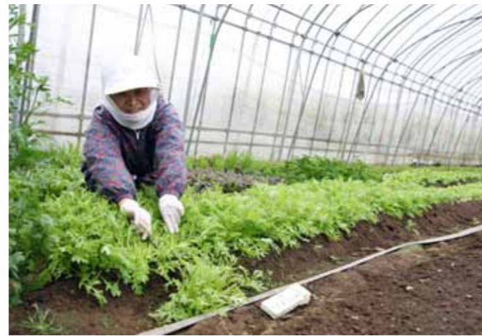
ベジタの里の収穫風景(4月22日撮影)

「六ヶ所の食材を、六ヶ所の人へ」。仲間と協力し合い、初めて朝市を開催。村の一次産業の活性化を願う取り組みの輪は、着実に広がり始めた。