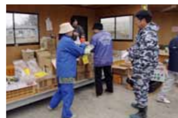
野菜を買求める地元のお客さん(4月17日やさしい朝市で)

村内の4社が朝市開設に協力。新鮮な根菜類、葉物野菜など村産の22種類の野菜や、泊産のタコ、イカ生干し、荒巻鮭などの海産物に加え、パンジーなどの花も販売。また、地元住民が協力しアザミなどの山菜や菊芋(通称・カ