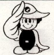
青森県警察シンボル マスコット「アビーくん」