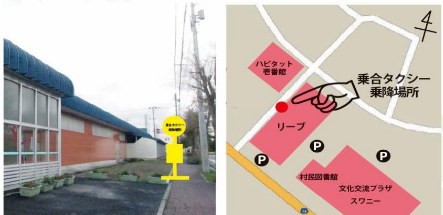
『ショッピングモール REEV (リーブ)』(六ヶ所村大字尾駮字野附 1-68)