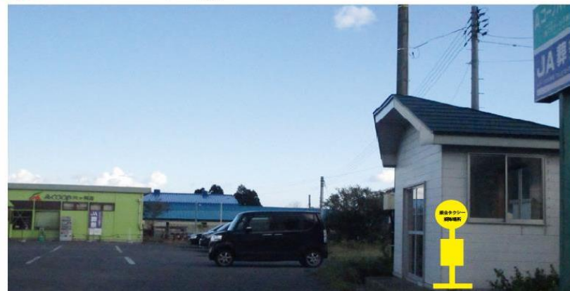
『あぐりサービス(株) A コープ六ヶ所店』(六ヶ所村大字平沼字久保 68-13)