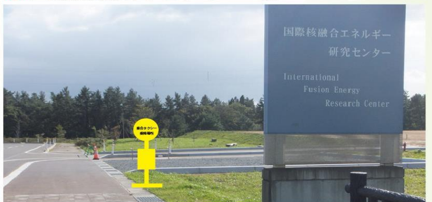
『国立研究開発法人 量子科学技術研究開発機構 六ヶ所核融合研究所』 (六ヶ所村大字尾駮字表館 2-166)