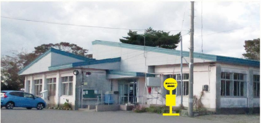
『平沼出張所』(六ヶ所村大字平沼字二階坂 26-1)