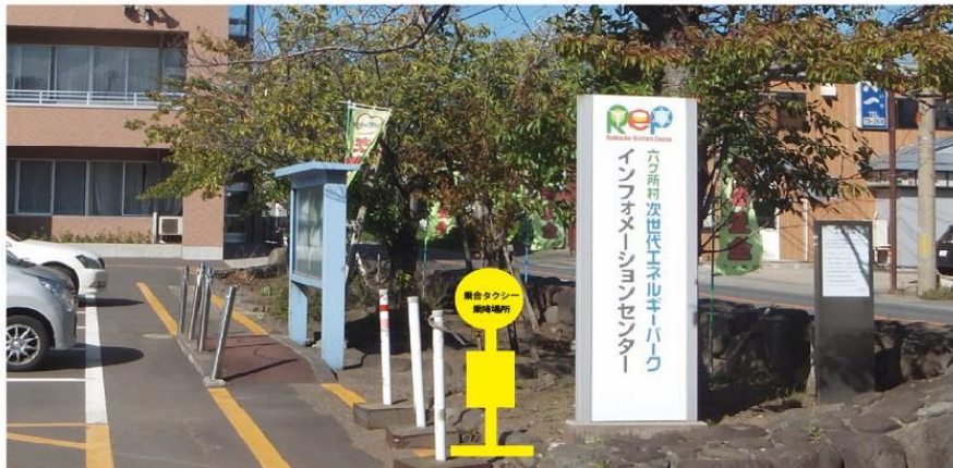
『六ヶ所村役場』(六ヶ所村大字尾駮字野附 475)