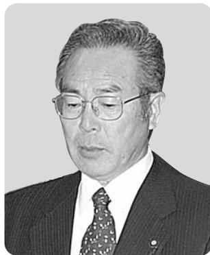
古泊 宏 議員

答 当村の奨学資金制度は、現在のところ青森県内で最も充実していると認識しているが、今後も住民ニーズに応えるため、努力していく。