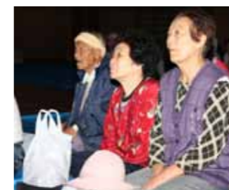
災害時に自分たちにできることは何か。自主防災組織や災害用伝言ダイヤルなどの説明に参加者は真剣なまなざしで聞き入っていた