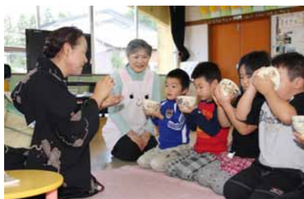
お茶の作法に熱心に聞き入る園児たち

尾駮保育所の乳幼児学級『幼児から躰ける生活作法』10月19日、同所で開かれ、年長の園児や子育て地域支援のメンバーたちがお茶の作法を学びました。