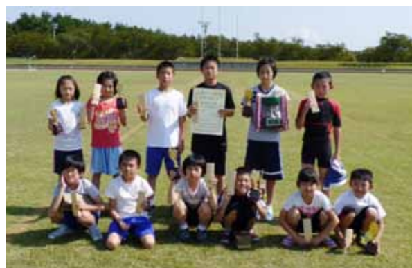
圧倒的な速さで4連覇を飾った千歳学区子ども会のメンバーたち

第27回六ヶ所村子ども会駅伝競走大会が10月2日、大石総合運動公園で開かれ、村内子ども会から5チームが参加し健脚を競いました。小学校1年から6年までの男女別12区間でたすきをつないだ選手たち。3区以降独走を続けた千歳学区チームが大会新記録で4連覇。8・11区では区間新記録が誕生しました。