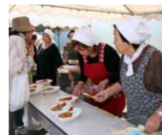
村赤十字奉仕団の泊地区団員や向日葵の会が炊き出し訓練に協力。手際良く、ハイゼックスを使った非常食を訓練参加者に提供した

と災害時にどう動いていいかわからないので、住民はもっと参加すべき。今日の訓練内容を仲間や友だちに教えて、声を掛け合うような体制づくりも必要」と話していました。 地震や津波などの災害はいつ起こるか予測できません。各家庭に配布している津波ハザードマップなどを壁に貼り避難所の確認をしてください。 自らの命は、自らで守る。一人一人が常に防災意識をもち災害に備えましょう。防災訓練は今後、継続的に実施する予定です。