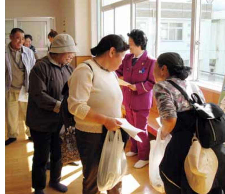
上_避難所の泊小学校に避難する地区住民たち 左_AED の使用方法の説明を受け、実際に体験。参加者は「泊地区ではどこに設置されているの？」などと積極的に質問していた 下_負傷した釣り人の救助・搬送訓練

地震による津波の発生を想定した防災訓練が 9 月 26 日、泊地区で実施され、地区住民 60 人のほか、野辺地警察署尾駮交番や六ヶ所消防署などの各種防災機関の約 150 人が避難所開設や津波災害対応などの訓練を通し、非常時の連携を確認しました。 訓練は、青森県東方沖を震源とするマグニチュード 8.2 の地震により、村で震度 6 強の地震を観測、六ヶ所沿岸での 3 m 以上の津波発生を想定。村災害対策本部は、気象庁による大津波警報発令を受けたとして、住民への避難指示を防災無線や広報車で進行