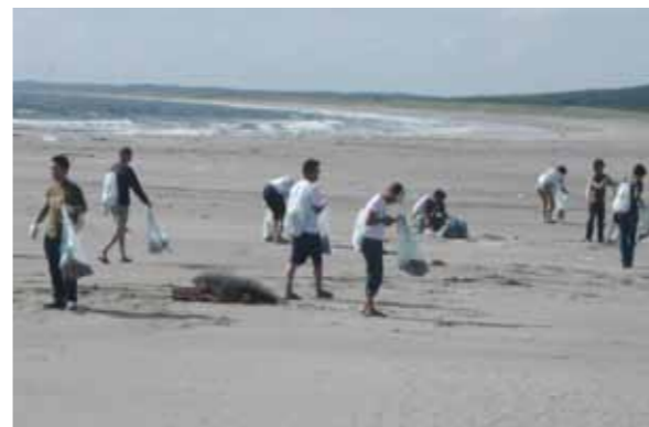
海への感謝として、ゴミ拾いをするサーファーの皆さん

六ヶ所村のローカルサーファーなど60人が9月12日、新納屋海岸の清掃を行いました。