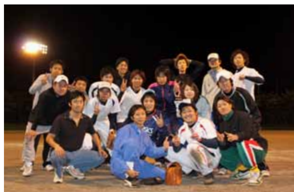
優勝したJテックのメンバー

第22回村制施行100周年記念職場対抗ナイターソフトボール大会が9月29日～10月1日の3日間、大石総合運動公園で開かれ、昨年に続きJテックチームが優勝しました。