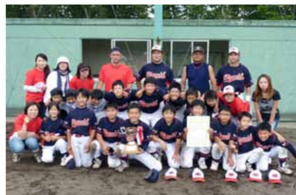
念願の初優勝。尾駮ベースボールクラブのメンバーたち

平成22年度六ヶ所村スポーツ少年団新人野球大会が9月18日、大石総合運動公園で開かれました。