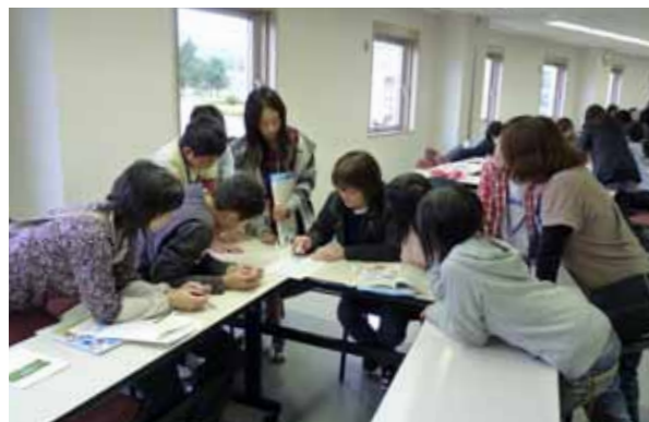
親子混成チームで挑戦した親子クイズラリー

産消交流「親子で行く六ヶ所村エネルギーツアー」（主催：経済産業省資源エネルギー庁、事業主体：六ヶ所地域振興開発㈱）が9月25日、26日に村内で開かれました。原子燃料サイクルを含むエネルギー理解を目的とする同事業は本年度2回目。宮城県の親子16組と村から泊バレースポーツ少年団（保護者含む）が参加しました。