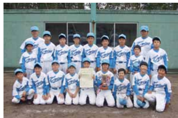
合併後初の栄冠。六ヶ所南スポーツ少年団のメンバーたち

第20回六ヶ所村スポーツ少年団大石カップ野球大会が10月3日、大石総合運動公園で開かれました。