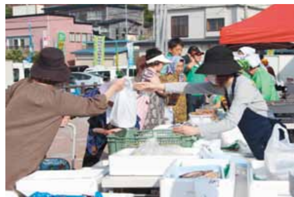
早朝から賑わいを見せる朝市

六ヶ所村商工会主催「ふるさと新鮮朝市」の1回目が7月12日、泊地区のイベント広場で行われ、訪れた多くの人たちが新鮮な農海産物を買求めました。