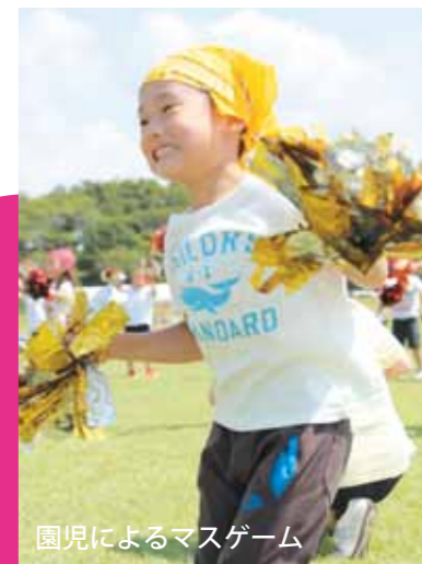
園児によるマスゲーム