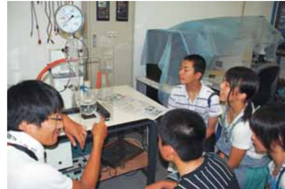
学生(左)から実験の説明を受ける生徒たち

東北大学キャンパス体験ツアーが7月30日～31日、東北大学で実施され、村内中学校3年生15人が同大で各種講義などを受講し、大学生気分を味わいました。