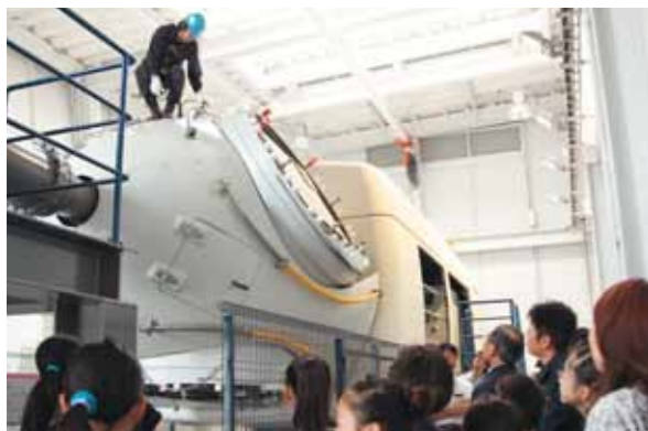
発電機の模型を点検する様子を見学

日本風力開発株式会社主催の「グローバルウインドデイ in 六ヶ所」が7月29日、二又地区のEESトレーニングセンターで行われ、小学生など約20人が風力発電について理解を深めました。