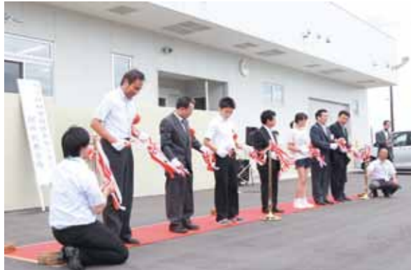
開所を祝い行われたテープカット

六ヶ所村学校給食センターの開所式が8月20日に行われ、関係者など約50人が集まりました。