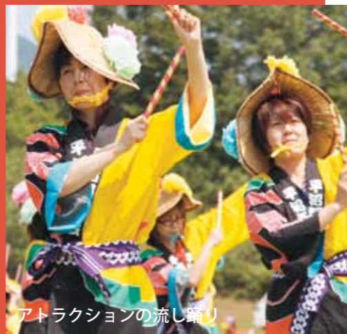
アトラクションの流し踊り