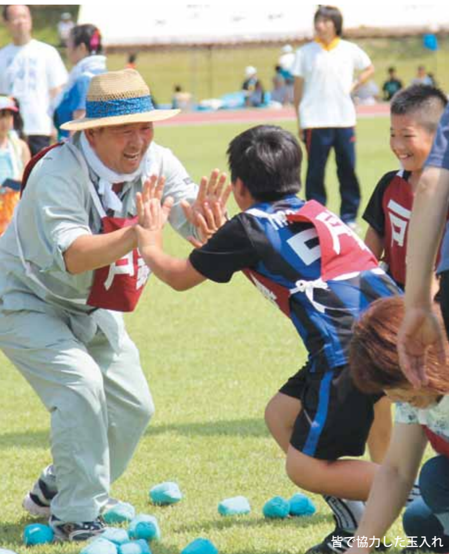
皆で協力した玉入れ