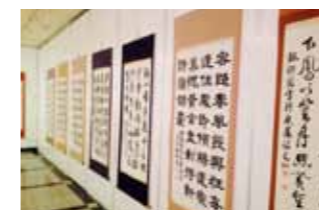
書道発表会へ出展された作品

一度、日中韓3国連携の国際行事へ参加した 際にも「昔から3国は漢字を使っている。だから、 漢字を使った交流ができるはず」という話もあり ましたが、不可能ではないと思います。