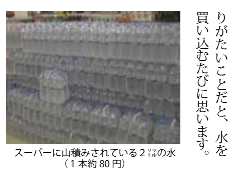
スーパーに山積みされている2%の水 (1本約80円)

それは、「水」です。 海外旅行を経験したことのある人なら分かるかと思いますが、水道水を直接飲む国は多くないらしく、韓国でも水道水を直接飲むことができません。