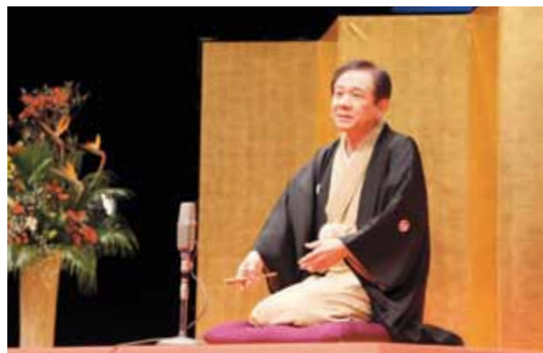
会場の笑いを誘う立川らく朝氏の講演 「ヘルシートークと健康落語」

平成 25 年新年を語るつどいが 1 月 9 日、文化交流プラザ「スワニー」で行われ、村内企業関係者など約 360 人が参加しました。