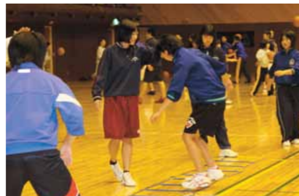
運動神経を高めるラダー（はしご状の運動器具）を使ってトレーニング

小中学生対象の六ヶ所村バスケットボール教室が 12 月 15 日、大石総合体育館で開催され、村内 4 校と招待された横浜町小中学生約 100 人がさわやかな汗を流しました。