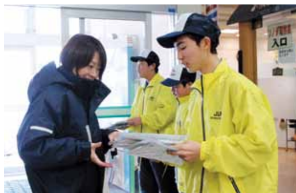
買い物客にチラシを配る JUMP チームメンバー

「110 番の日」広報活動（主催：尾駁交番〈高坂尚孝所長〉・六ヶ所村交番駐在所連絡協議会〈金澤光秀会長〉）が 1 月 10 日、ショッピングモール「リープ」で行われました。