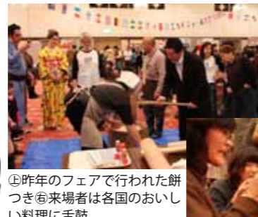
④昨年のフェアで行われた餅つき⑤来場者は各国のおいしい料理に舌鼓

開催日 2月24日 時間 正午～午後3時 場所 スワニー 参加費 無料 参加予定国 日本、フランス、スペイン、イタリア、インド、インドネシア、アメリカ、カナダ、韓国、ドイツ