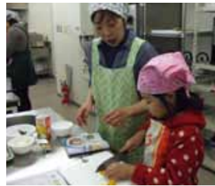
お母さんと一緒にチャレンジ

「親子クッキング教室」を12月26日、文化交流プラザ「スワニー」で開催しました。 この事業は、食生活改善推進員会（ヘルスメイト）が親と子のコミュニケーションを図り、料理づくりの楽しさを知ってもらうために実施しています。当日は11組（計34人）の参加があり、6グループに分かれて調理しました。 参加者は「楽しかった、家でも作ってみたい」「包丁を使うのが難しかったけど、うまく切ることができて良かった」と話していました。 悪天候にもかかわらず、たくさんご参加いただき、ありがとうございました。来年度も開