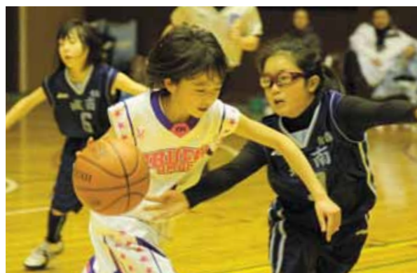
スポーツ少年団の新人戦（尾駁⑤と七戸⑥の試合）

六ヶ所村スポーツ少年団ミニバスケットボール大会新人戦および六ヶ所村中学校女子バスケットボール大会新人戦が 1 月 19 日、大石総合体育館で行われ、村内外から 7 チームが出場し、熱い戦いを繰り広げました。