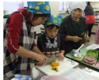
包丁で野菜、うまく切れるかな