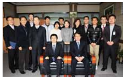
約1年を共にした企画監査室の皆さん