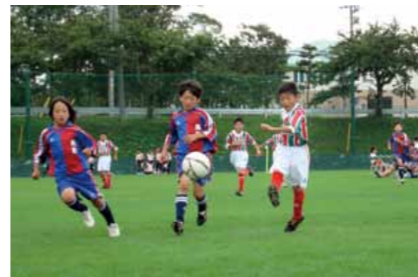
熱戦を繰り広げた選手たち

「U-10 六ヶ所サマーカップ」（六ヶ所村体育協会主催）が 8 月 22 日、23 日の 2 日間、大石総合運動公園で開かれました。 大会には村内外から 10 チームが参加。試合は 5 チームずつが 2 つのグループで予選を行い、代表チームがトーナメント形式で熱戦を繰り広げました。 同事業は村制施行 120 周年協賛事業の一環。今後は、12 月 5 日～6 日に「六ヶ所 U-12 フットサル大会」（12 歳以下）、2 月 20 日～21 日には「六ヶ所 U-10 フットサル大会」（10 歳以下）の開催を予定しています。 〈試合結果は次のとおり〉 優勝 多賀レッドスター（八戸市） 準優勝 ヴァンラーレ八戸（八戸市）