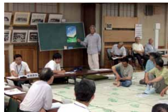
活発な意見や質問が出されました（出戸地区）

村民の皆さんの多くの声を村政に反映させることを目的にした「村長室出前ふれあいトーク」が 8 月 20 日、戸鎖地区と出戸地区を対象に開かれました。 村長室で行われた戸鎖地区対象のふれあいトークには、地区住民 6 人が出席、出戸集会所で行われたふれあいトークには地区住民 35 人が出席しました。福祉、原子力行政や環境に関することなどが次々と質問され、古川村長や村の幹部職員と活発に意見交換がされました。 【今後のスケジュール】 9 月 25 日（金） 庄内地区（庄内集会所）、千歳地区（千歳集会所） 10 月 20 日（火） 二又地区（二又集会所）