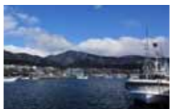
中央に見えるのが貴宝山

泊地区住民の信仰を集める貴宝山は、男女とも頂上まで2時間ほどで登ることが出来ます。標高約400メートルの頂上からは太平洋、陸奥湾の青海原を見下ろすことが出来ます。ガイドと共に、貴宝山の豊かな自然や歴史を肌で感じてみませんか。