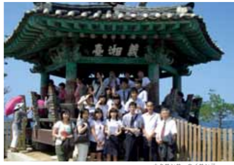
ヤンヤン郡の景観8景の一つ「洛山寺義湘台」

交流推進と国際性豊かな人材育成を目的に行われてきた同事業。今年は、派遣が7月29日から8月3日の6日間、受け入れは8月5日から8日の4日間の日程で行われました。六ヶ所村からは六ヶ所高校の生徒6人が、韓国襄陽郡からは、襄陽高校5人・襄陽