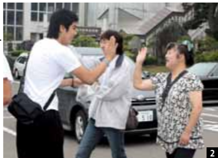
1_ ヤンヤン郡の生徒たちと一緒にスワニーで茶道体験 2_ ヤンヤン郡生徒たちの見送り。受け入れ先の保護者と別れのあいさつをする生徒 3_ ヤンヤン郡の古刹「落山寺」で