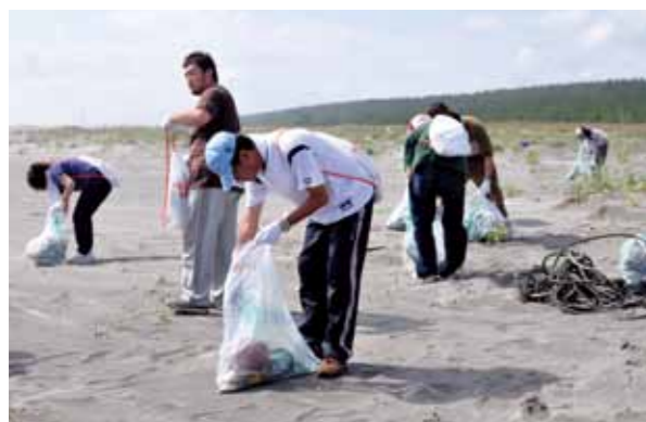
流れ着いたごみや、生活ごみなどを拾う参加者

「第 5 回六ヶ所村太平洋沿岸クリーンアップ作戦」が 9 月 5 日、尾駁・出戸地区の海岸で実施されました。 同事業は、六ヶ所村と六ヶ所村まちづくり協議会の共催。これまで泊、尾駁の海岸でごみ拾いを行ってきました。 この日は、地元町内会をはじめ村内各自治会、村建設業協会、村産業協議会、家庭ごみ収集委託業者などから約 300 人が参加し、尾駁漁港から出戸川河口まで約 5 キロメートルの海岸線のごみを拾いました。集められた約 10 トンほどのごみは、タイヤショベル 6 台、クローラダンプ 2 台、ゴミ収集車 3 台などで運搬されました。村担当者は「協力してくれた皆さんに感謝。しかし、ごみはまだまだある。ごみを捨てない心がけと、これからも協力をお願いしたい」と話していました。