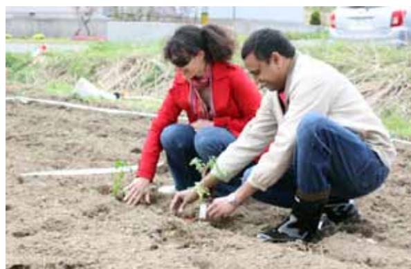
ガーデンに苗を植える参加者たち

村在住外国人などにガーデニングや農業を楽しんでもらおうと村が整備していたインターナショナルファミリーガーデンが完成し、5月22日、オープニングセレモニーが開かれました。