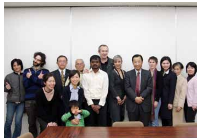
フランス語教室。3人の先生と生徒たち（5月13日）