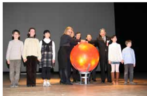
太陽のモニュメント上で関係者と握手する古川村長(右から4人目)と尾駁小・インターナショナルスクールの生徒たち

国際核融合エネルギー研究センター施設完成記念式典が4月27日、文化交流プラザ「スワニー」で開かれました。