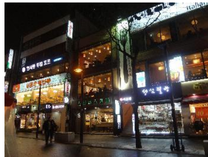
ソウルのインサドン

真中の緑の看板のところはスターバードです。 (ハンゲルで、スターバックスコーヒーと書かれています)