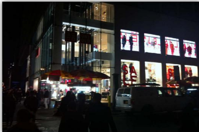
Uniqlo, Fifth Avenue, New York

ユニクロは安くて高品質、そしてどこでも見つけることができます。多くの日本人はユニクロが好きだと思います。お正月中、友達に会いにニューヨークに行って、買い物と観光を楽しみました。ニューヨークではどこでも、ユニクロのマークを見ることをできました。皆がユニクロの紙袋を持っていたし、地下鉄の中にも広告があつて、びっくりしました。今アメリカでは三つのユニクロの店があります。二つはニューヨークにあつて、一つはカリフォルニア州にあります。ほとんどのアメリカ人はまだユニクロのことあまり知りませんが、そろそろこれが変わると思います。1年後2年後アメリカではユニクロがたくさんできると思います。