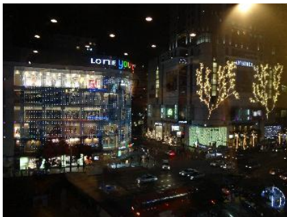
ソウルの中心、ミョンドンのロッテデパート前