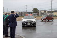
パレードに出発する車列

式では、参加者が交通安全意識の向上と事故防止への決意を新たに、村内各地に出発。ドライバーや歩行者に交通安全への協力を呼び掛けました。