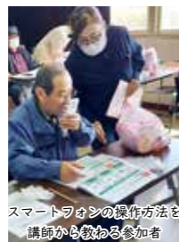
スマートフォンの操作方法を講師から教わる参加者

「シニア男部」は千歳平地区で毎月の開催を予定しています。詳細は、地域包括支援センター室までお問い合わせください。