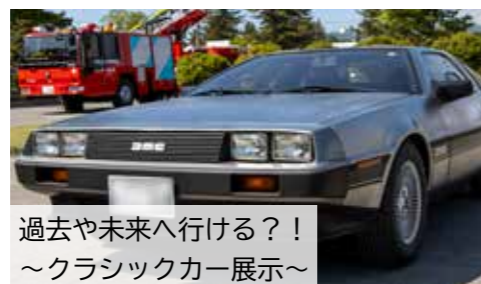
過去や未来へ行ける？！～クラシックカー展示～