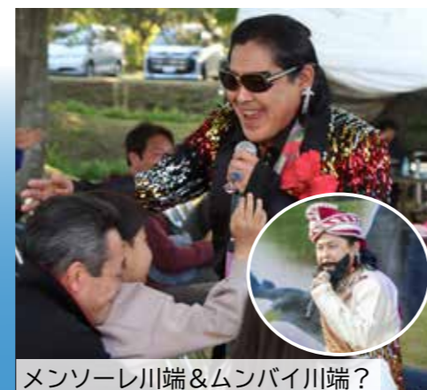
メンソーレ川端&ムンバイ川端？