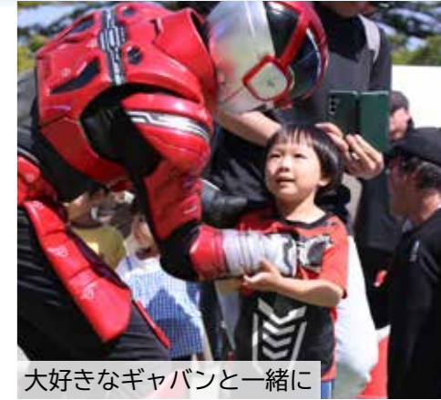
大好きなギャバンと一緒に