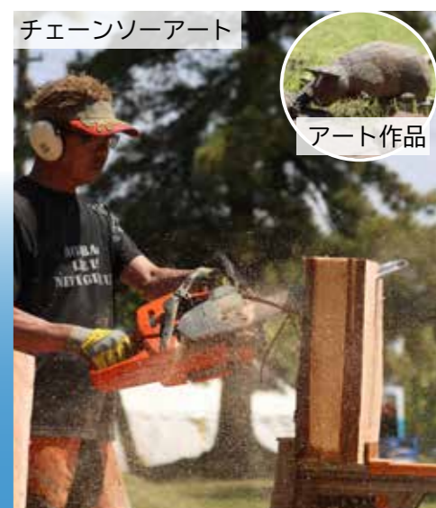
チェーンソーアート