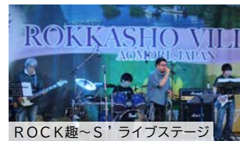
ROCK趣～S' ライブステージ