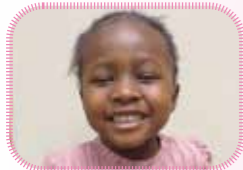
シェリフ ダイアナ ディヴァ シリムリエル アイちゃん