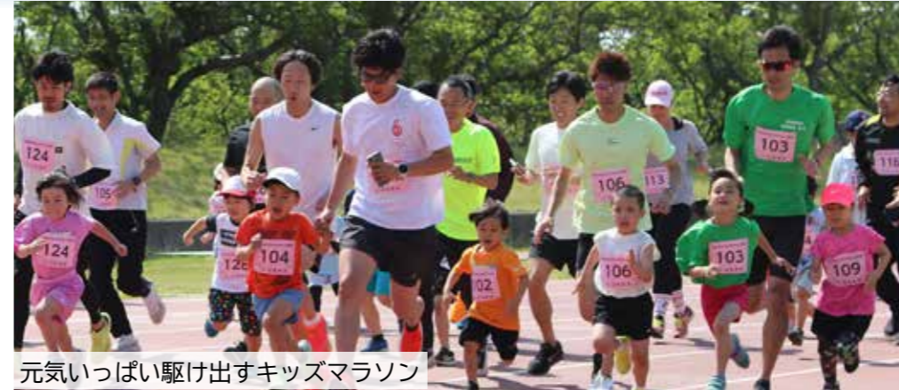
元気いっぱい駆け出すキッズマラソン