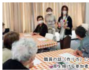
職員の話し（作り方）に耳を傾ける参加者

参加者は、透けている折り紙や光沢がある折り紙など自分で選んだ折り紙でチューリップを折り、すてきな花束に仕上げていました。