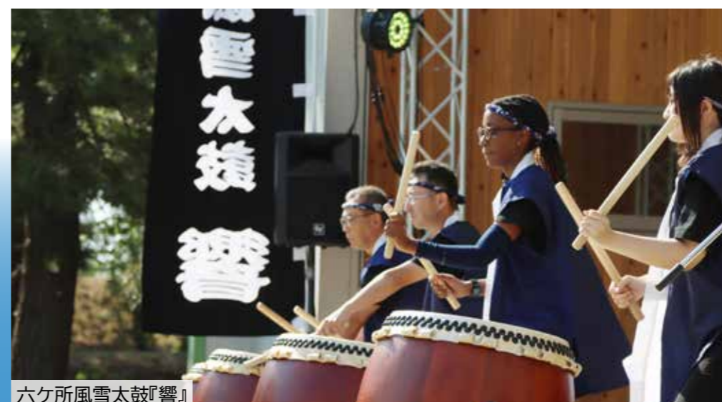
六ヶ所風雪太鼓『響』