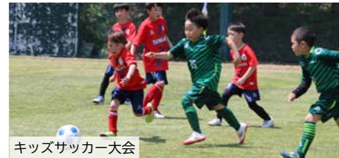
キッズサッカー大会