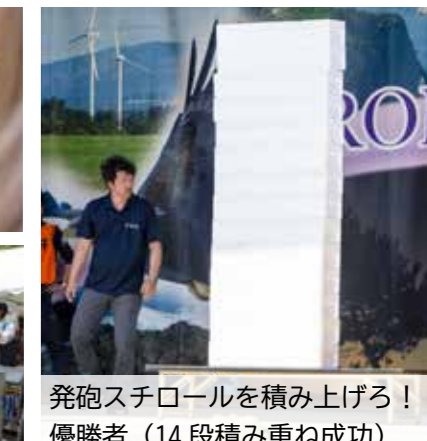
発砲スチロールを積み上げろ！優勝者（14段積み重ね成功）