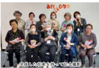
完成した花束を持って記念撮影

おれんじカフェ 認知症の人やその家族、専門の職員、地域の皆さんが、交流や情報を交換をする場として開催されるカフェです。専門の職員が必ず参加していますので、認知症に関する相談ができます。お気軽に、ご参加ください。