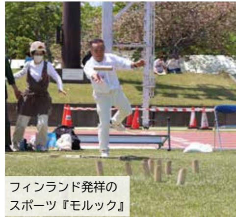
フィンランド発祥のスポーツ『モルック』